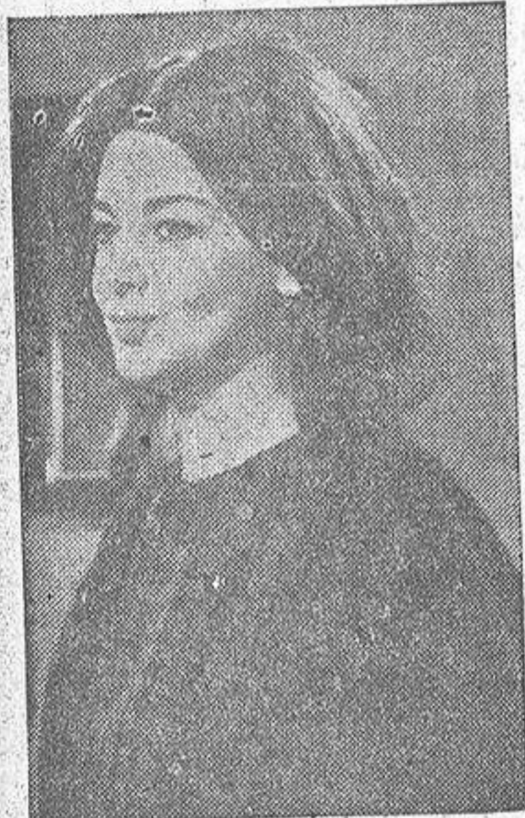
Eleonora Rossi-Drago, una de las más bellas actrices del cine italiano, que figura en el cuadro interpretativo de la película "Hipnosis"

AUNQUE parezca imposible, esta semana no hay ninguna película norteamericana entre los cinco estrenos de las carteleras locales. Una circunstancia indirectamente beneficiosa para el cine que produce Hollywood, porque el material exhibido actualmente poco aprovechable hay en cuanto a calidad y valía se refiere. No quiere esto decir que sea preciso ver cine del otro lado del Atlántico para conocer lo bueno, demostrando está el talento de los realizadores europeos, sin necesidad de encerrarse en el círculo de Antonioni, Bergman y otros integrantes de la vanguardia novedosa para el público español. Ocurre, simplemente, que Norteamérica logra, casi siempre, un cine fundamentalmente comercial, avalado por la colaboración de actores y directores pagados al mejor precio. De ahí la lucha sostenida contra la influencia de la televisión, en una batalla que las partes beligerantes no se resignan a perder.