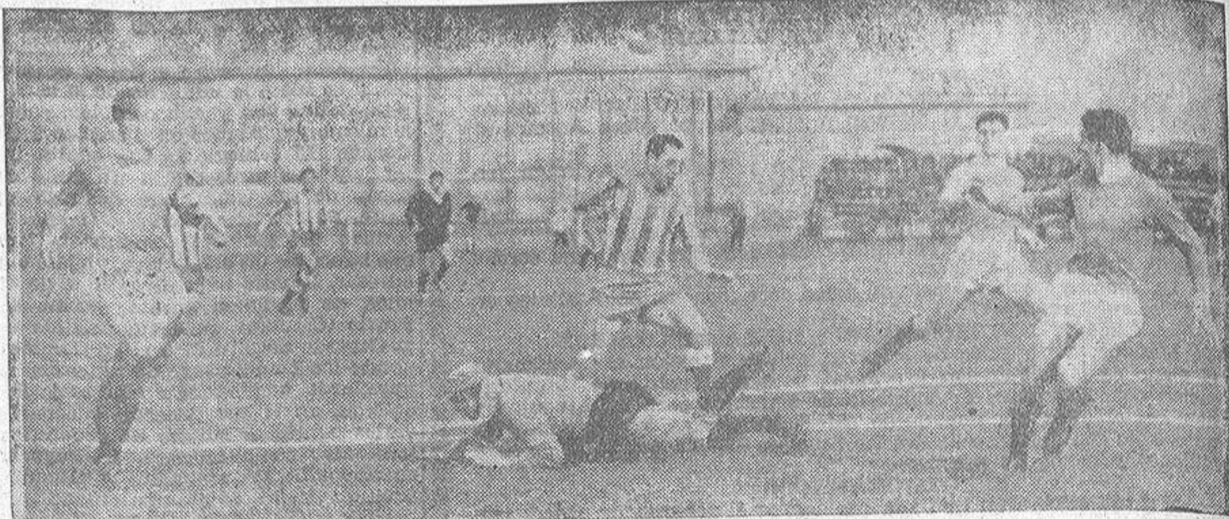
He aquí uno de los momentos de acoso deportivista a la portería del Valladolid.