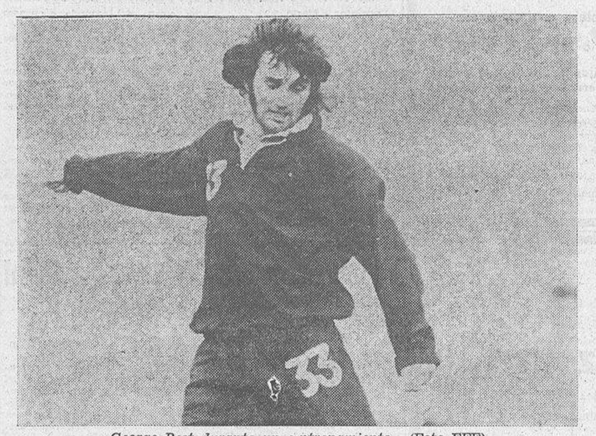
George Best durante un entrenamiento.

"De verdad que no lo sé", fue su respuesta. "Creo que nunca lo