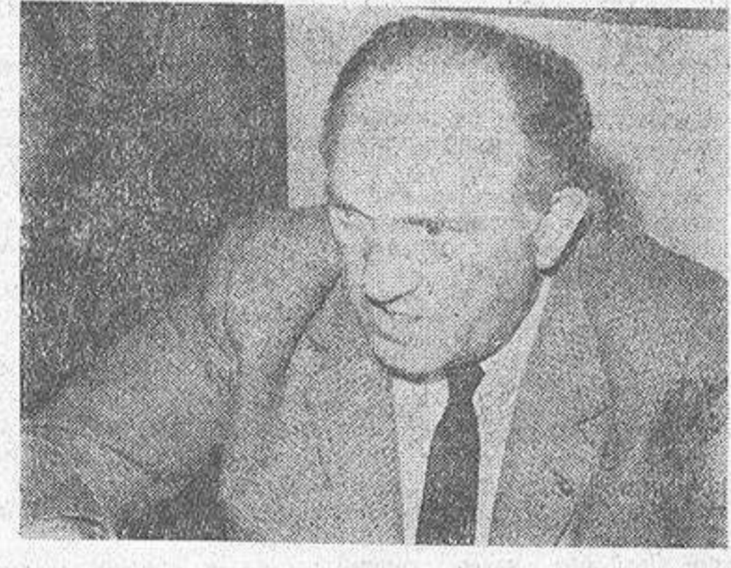
Don Cristino Alvarez, actual presidente de la Federación Gallega de Fútbol, que se presentará a la reelección en su cargo