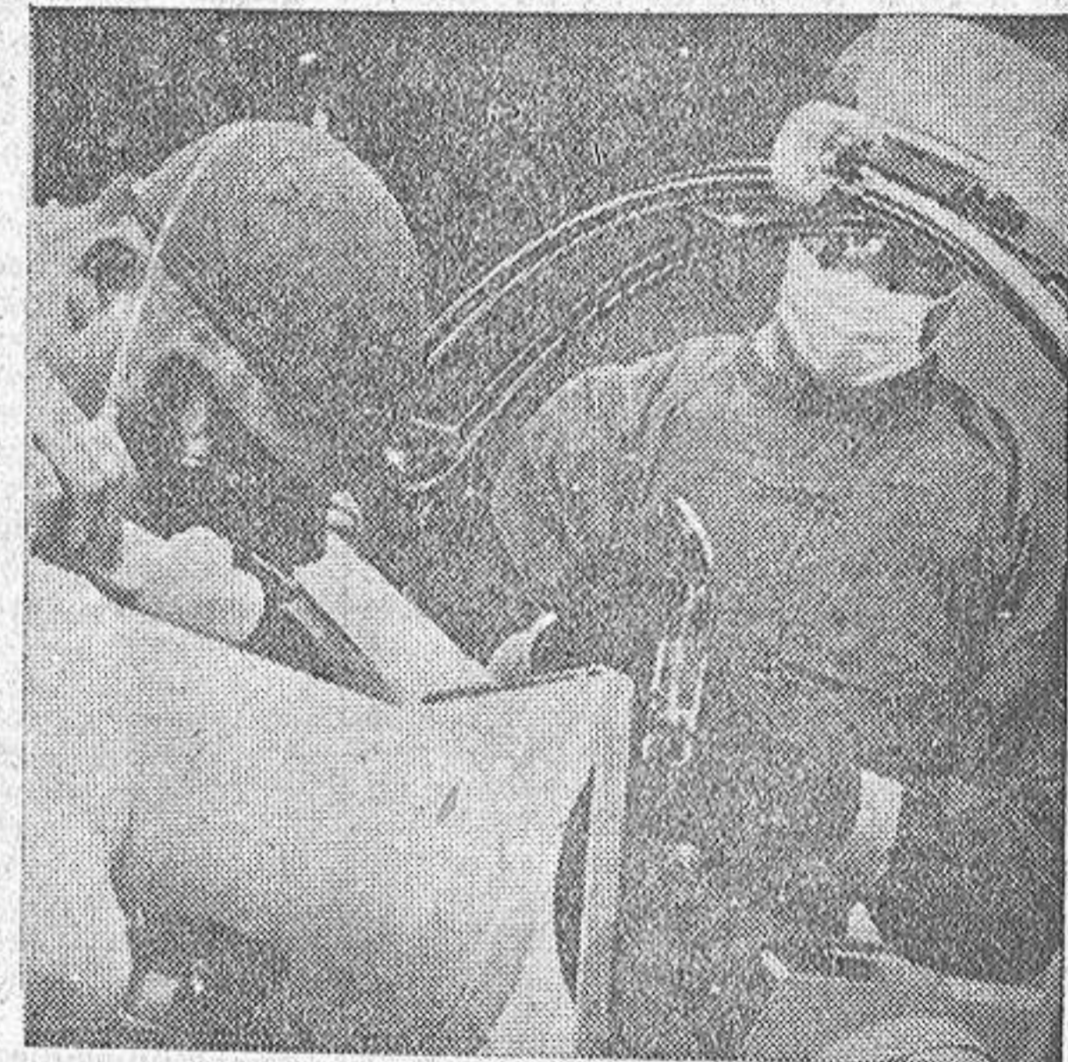
Médicos de un hospital, en cualquier ciudad del mundo, intentan con diversas técnicas la reanimación de un ser aparentemente muerto.

Los mantenedores de esta segunda tesis recurren a dos motivos para justificarla: uno, de orden moral profesional, según el cual el deber del médico es no abandonar ninguna esperanza mientras se encuentra junto al lecho del enfermo. El otro motivo es de orden jurídico: la nueva vida puede significar una situación patrimonial o de carácter económico y legal que el médico tiene el deber de apoyar, aunque y aquí surge la cuestión pura-