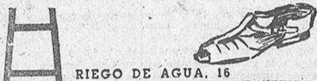
RIEGO DE AGUA. 16