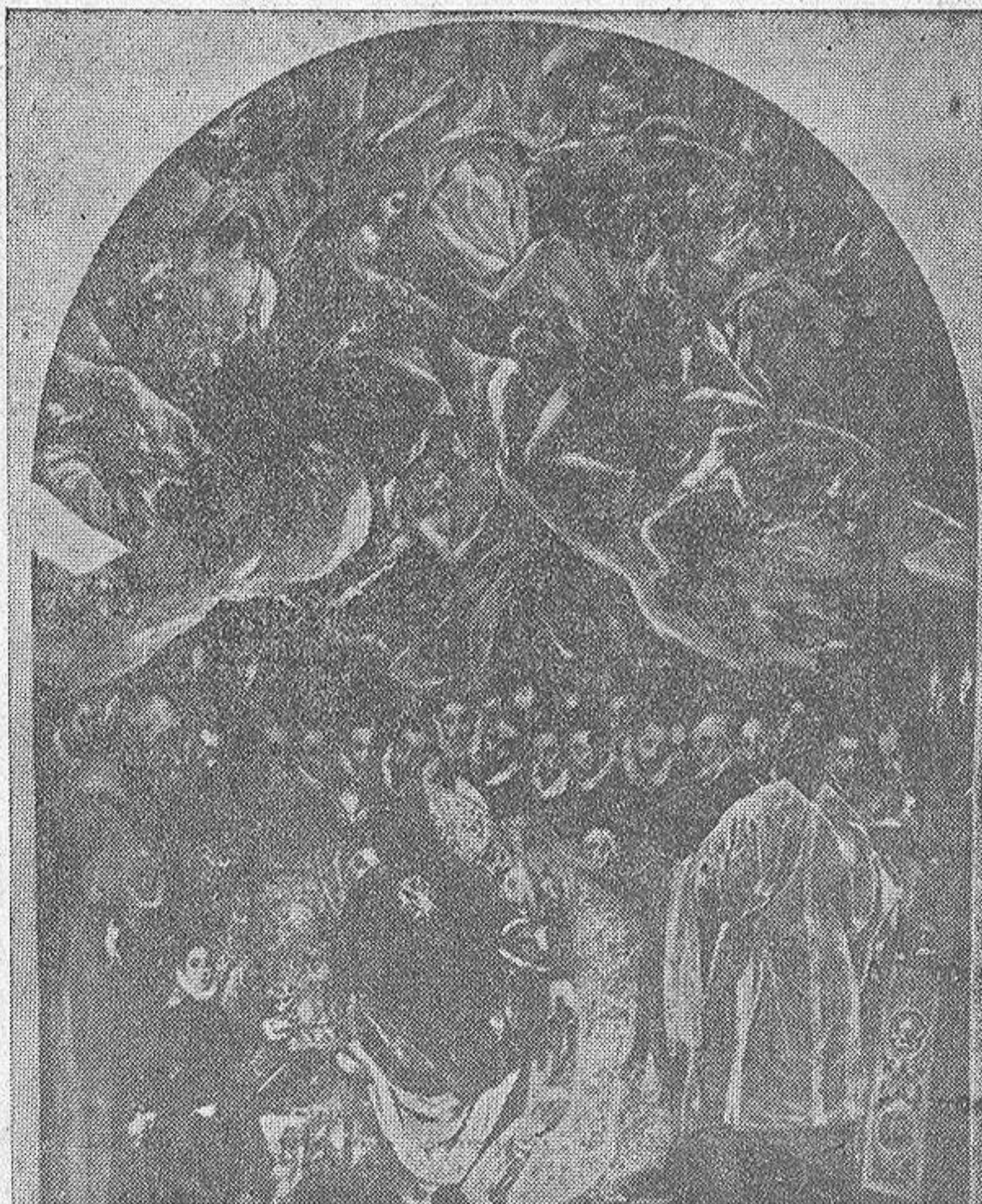
"El entierro del Conde de Orgaz", el más famoso cuadro del Greco, que se conserva en la iglesia toledana de Santo Tomé

—Al alejarse los frentes de Toledo, próximo ya el final de la guerra. Mientras estuve yo en Toledo aprovechamos la circunstancia de hallarse el cuadro descolgado para proceder a la localización y corrección de la humedad que de antiguo venía acusándose en la parte baja de la pared donde se hallaba instalado el cuadro. Seguidamente y a fin de asegurar la ventilación de esta impor-