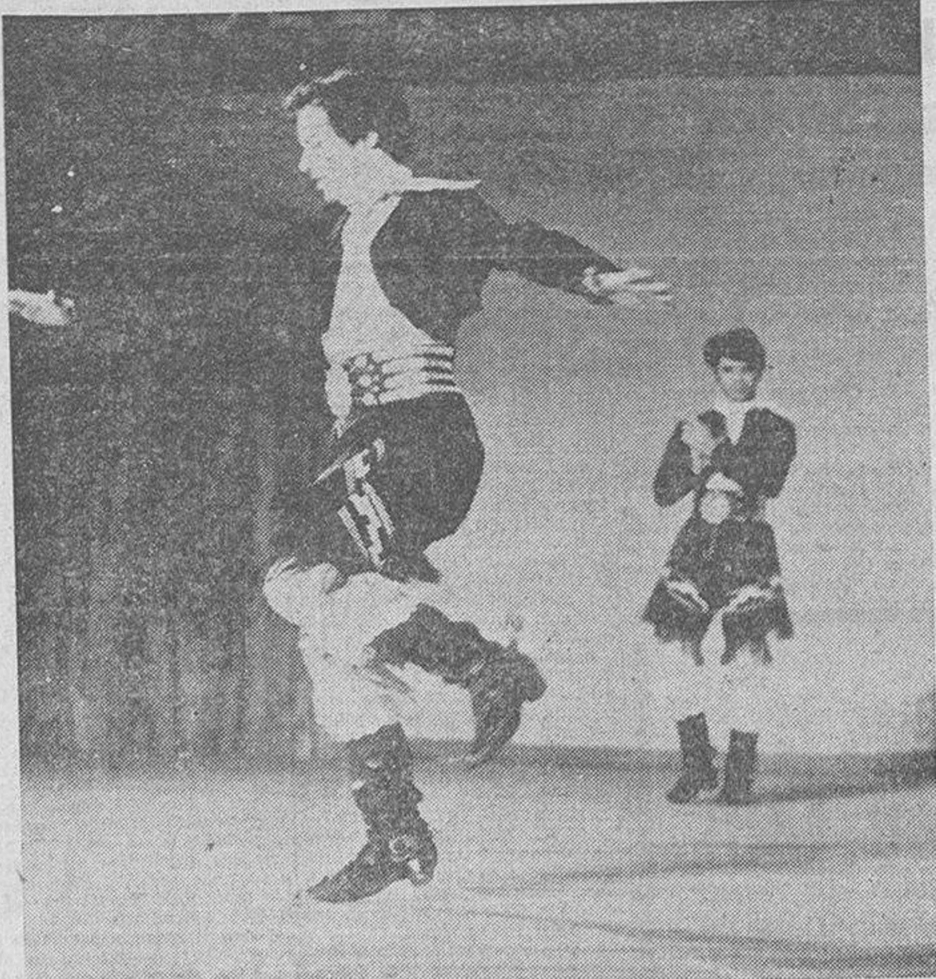
"Gaucho", la danza de los pastores argentinos, un número del Conjunto Académico de Danza Popular de la URSS.