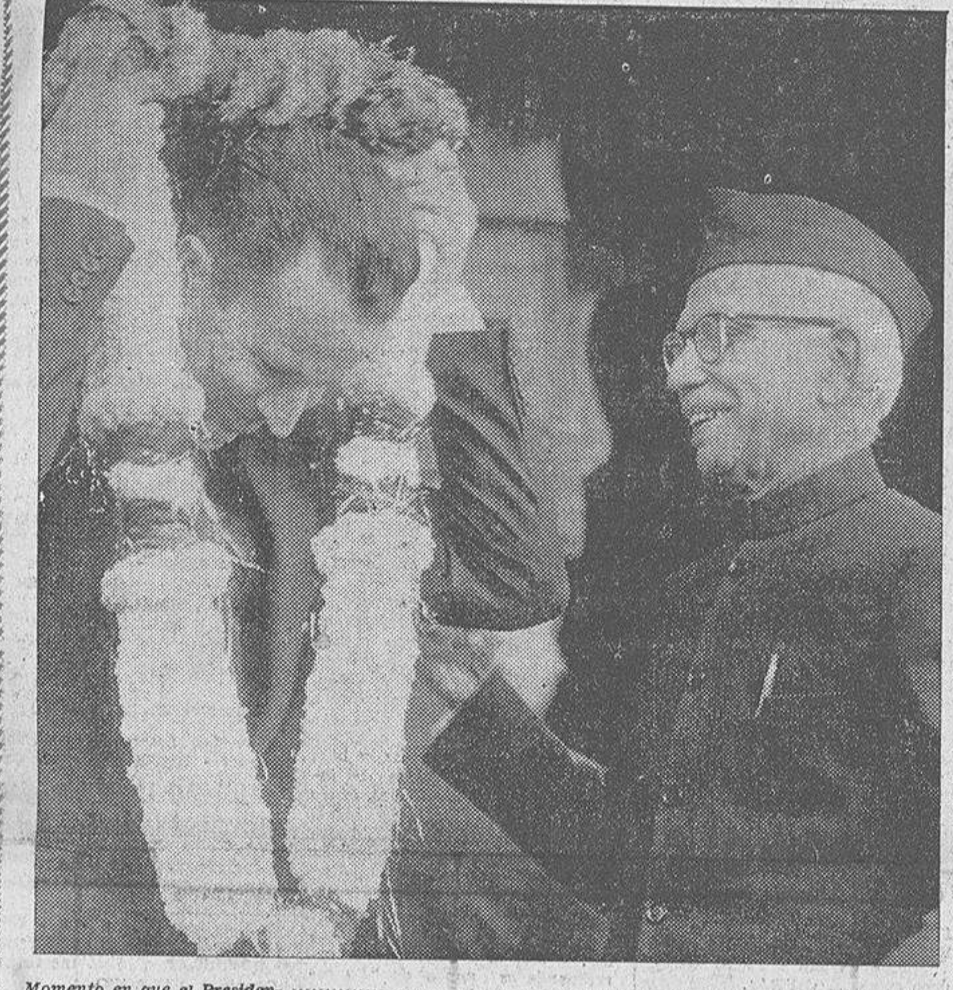
Momento en que el Presidente de la India, M. Giri, ofrece a Balduino de Bélgica el collar tradicional de bienvenida. Los soberanos belgas han sido huéspedes de la ciudad de Nueva Delhi, y en su honor se organizaron diversas fiestas. Motivos folclóricos y espectáculos al aire libre, presididos por un rito ancestral y llenos de etiqueta propia del pueblo hindú, han servido para que Balduino y Fabiola se familiarizaran con las tradiciones milenarias de este pueblo. La capital de la India pocas veces había desplegado tanta actividad para agasajar a unos visitantes extranjeros. Así se explica, que los reyes de Bélgica se sintieran conmovidos por las muchas atenciones tenidas con ellos durante su visita al país.