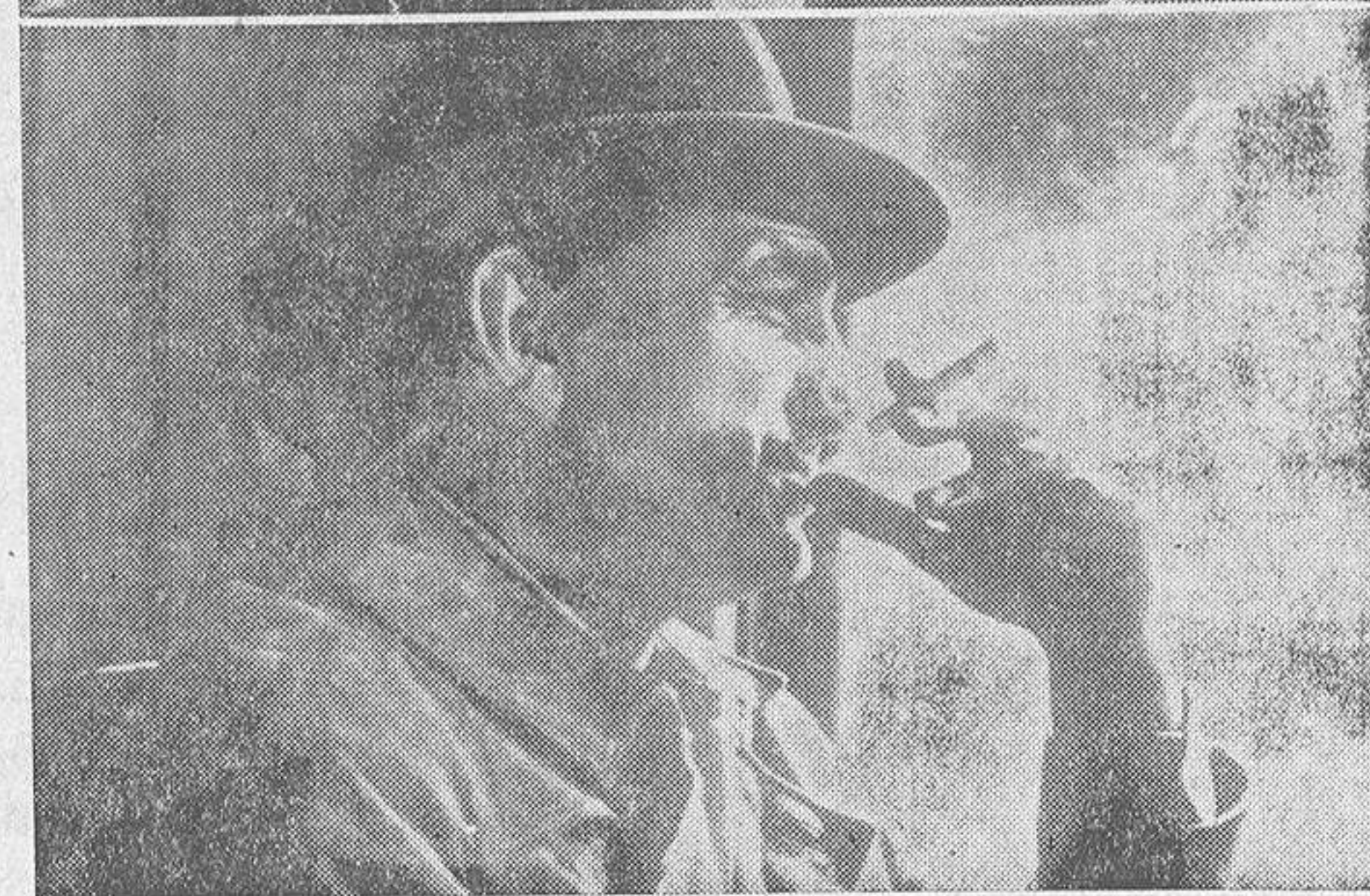
He aquí a Lino Ventura, en dos de sus actitudes características