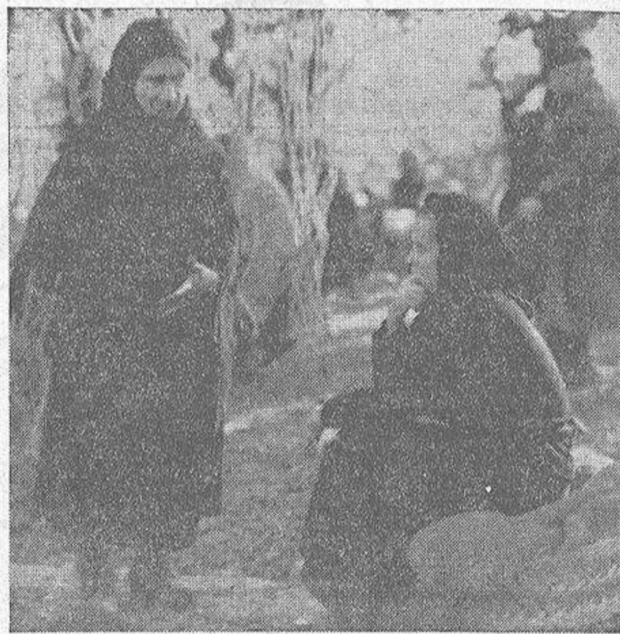
La despoblación del campo, por ausencia de la gente joven que emigra al extranjero o se traslada a las ciudades, traerá como consecuencia el abandono de los cultivos. Si no se pone remedio a este problema, el fenómeno traerá fatales consecuencias al agro gallego. En el grabado, dos campesinas charlan sobre la estancia de sus hijos en el extranjero, adonde han ido a probar fortuna, iniciada al parecer según explican en sus cartas.

ficio comercial, interés del capital, ampliaciones y, en algunos casos, amortización del equipo de producción. Si se va al extranjero aportará las tan anheladas divisas de un lado y otro del «telón de acero» para con ellas renovar estructuras de producción.