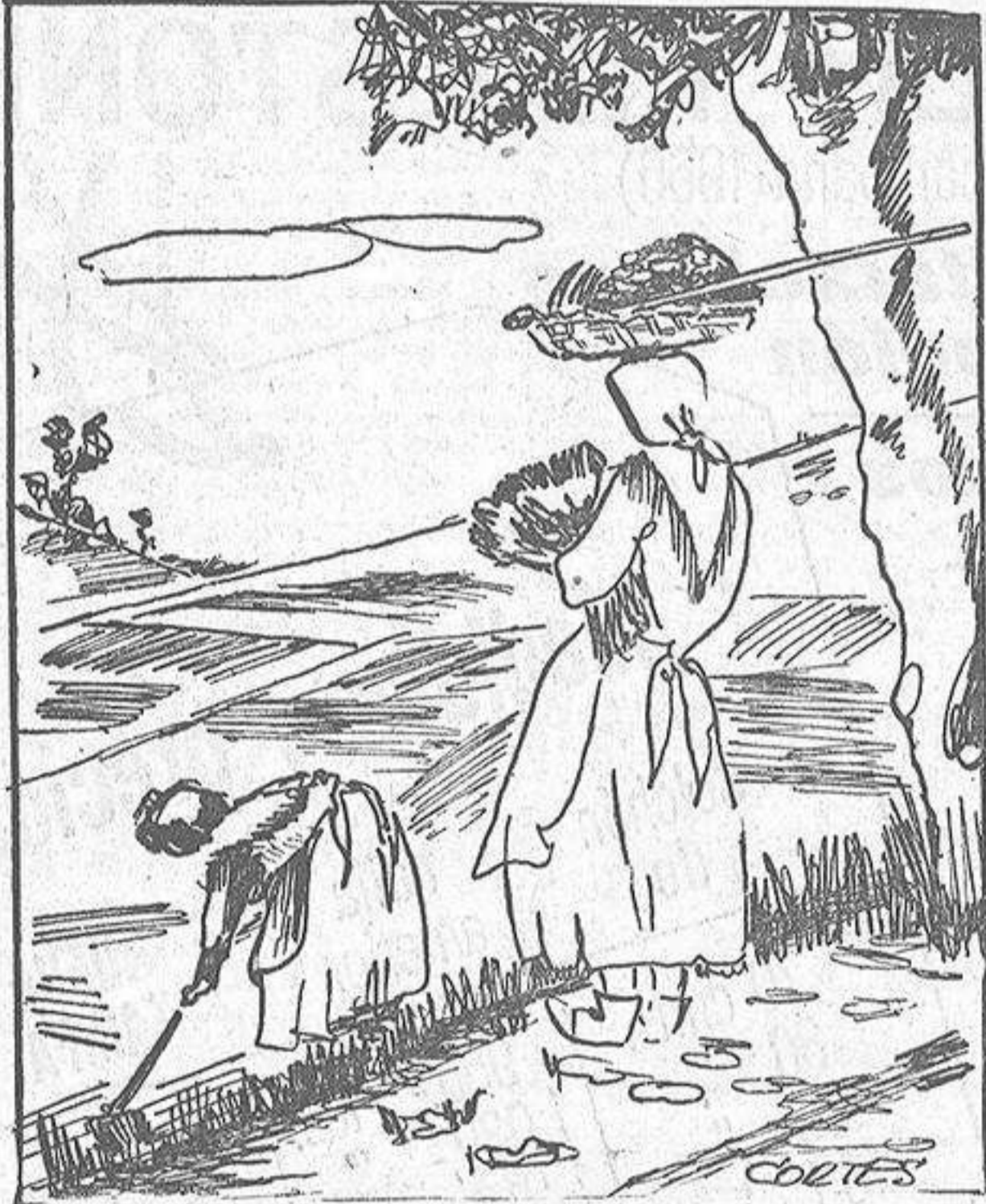
Caricatura de quien cree que el campo es solo esa cosa a la que se va de excursión los domingos...

Así se explica lo que luego se lamenta. Calculen ustedes que del campo gallego ha desertado en los últimos diez años no menos de quinientas mil personas y no estarán muy lejos de la realidad. Porque el hecho se agrava si pensamos que se han ido precisamente los mejores. No los mejores en bondad, sino en rendimiento. ¿Quién encuentra hoy sobre nuestros campos a un hombre joven? Casi ni siquiera se ve a la mujer joven, igualmente llevada