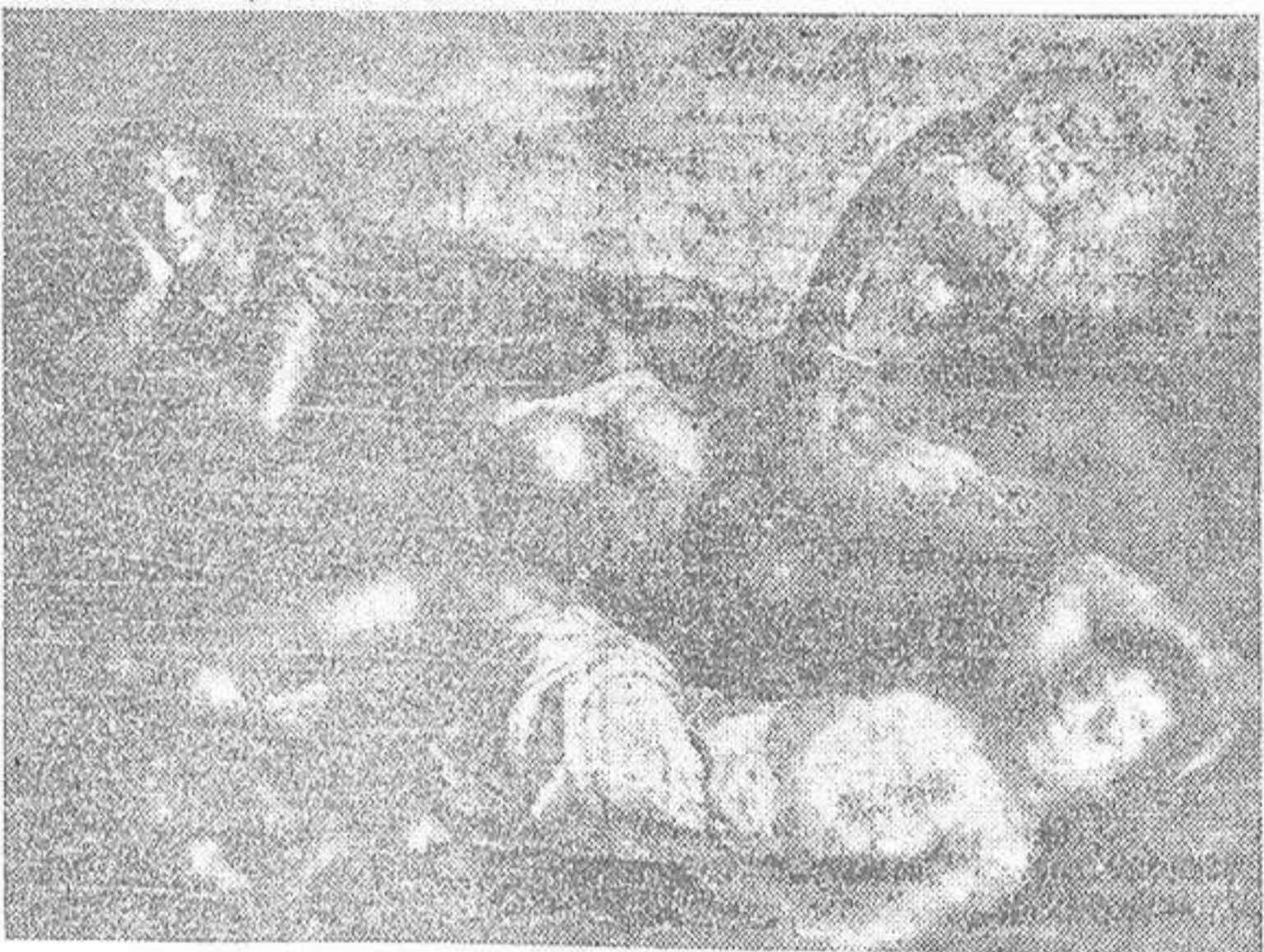
ESTIO, óleo de José Aguiar

mo, de construcción sólida, con esa humildad de la mirada que vive y esa blandura del trazo de la boca que dice tanto del carácter de la dama. Camilo José de Cela ha sido captado con penetración agudísima. Bajo esa frente que se abomba vive un mundo. No hace falta que un rótulo nos diga a que se dedica este hombre; su continente, los objetos que hay sobre la mesa valen por una larga etopeya. ¿Y qué decir de ese desnudo al temple efecacísimo de dibujo y de una riqueza colorista encantadora? Como si el procedimiento no tuviera dificultad alguna, en este desnudo todo produce una sensación de reposo, desde el ritmo del contorno femenino hasta la suave gama del fondo, tan decorativa y tan elegante a un tiempo mismo.