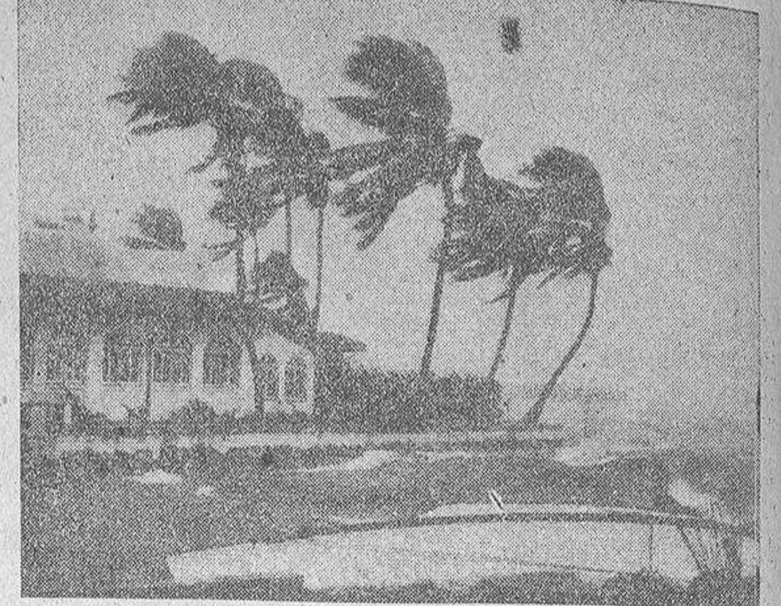
A una velocidad de 250 kilómetros por hora, el viento huracanado acaba de asolar Jamaica y la península de Yucatán, llegando, aunque con menos violencia, al Norte de Méjico. La foto recoge uno de los momentos iniciales del fenómeno, despeinando las airoas palmeras de aquella isla.