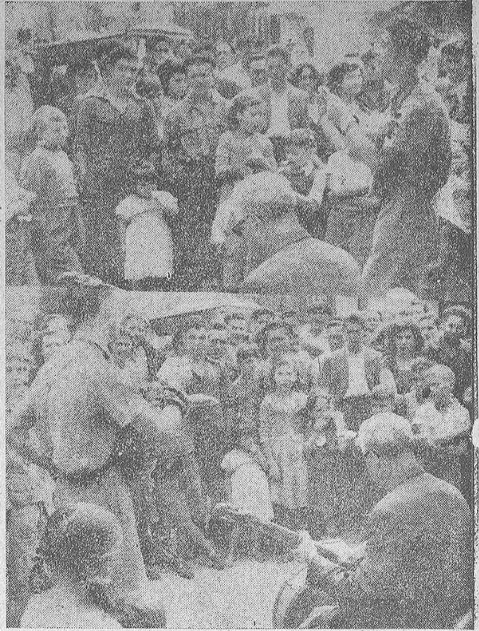
El coruñés, que casi nunca tiene prisa, además de ser frenado en su marcha por los cortejos nupciales, se extasia ante los alardes musicales. Los cánticos de coplas como "Los cuatro hermanos gemelos", "La desgracia de la morena Carmela" o "No hay nada mejor que un negro", acompañados por esa orquesta ambulante, encajada por razones económicas en un par de hombres, son capaces de parar el tráfico humano cuantas horas sean precisas. Faenas caseras y tajes laborales, pueden aguardar en aras del arte. Y como estamos en vacaciones escolares queda completo el cuadro. Es la vida, señores

Sólo un diez por ciento de las vencedoras ven sus vidas modificadas como consecuencia del éxito. Algunas logran hacer un matrimonio ventajoso; otras se convierten en maniques. Dorothy Hocking logró un triunfo original, después de su proclamación de "Miss Biviera inglesa"; ahora toca el