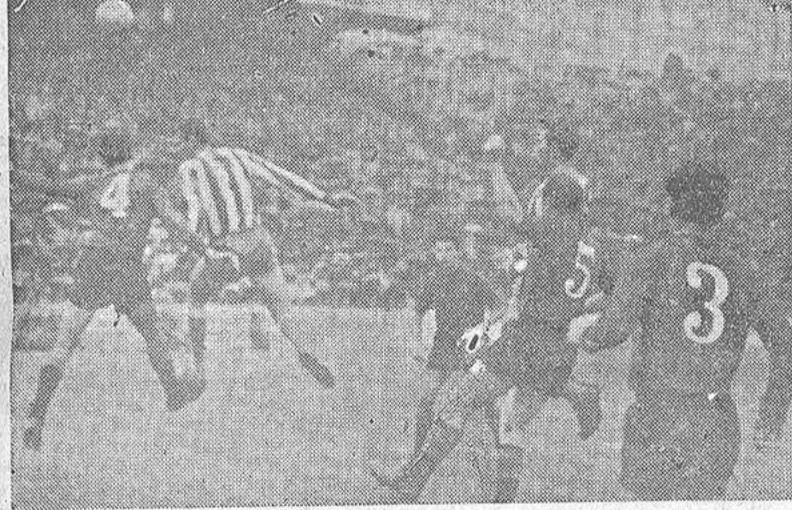
Acosado por Loureda y Sanjuán, el portero mallorquín logra hacerse con la pelota en uno de los frecuentes ataques coruñeses ante la portería insular.