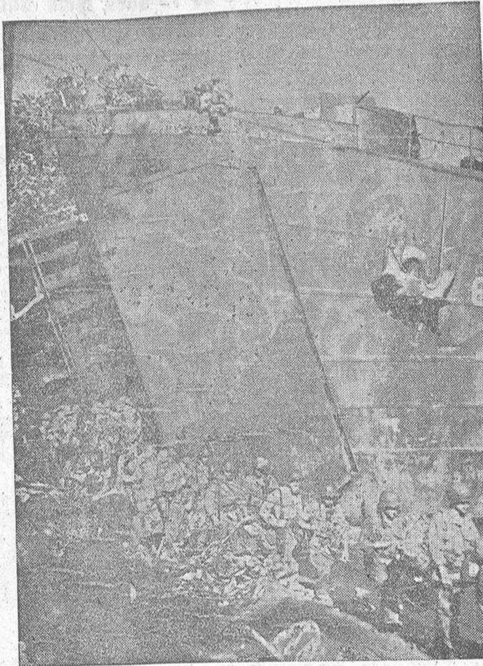
Tropas norteamericanas saliendo de las fauces abiertas de una barcaza de desembarco, en la playa de una isla del Pacífico