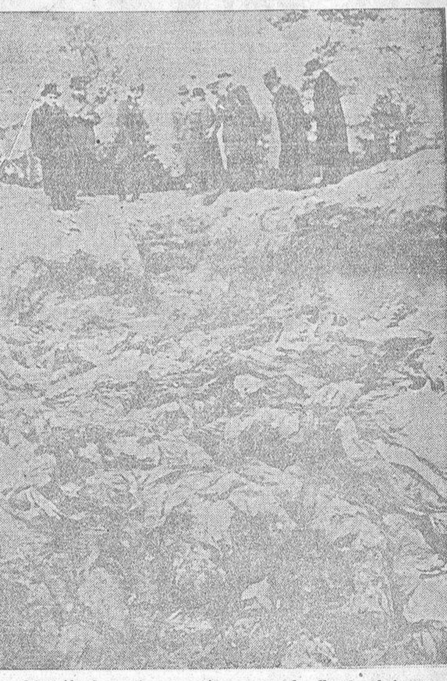
Una delegación de escritores y poetas europeos ha llegado al bosque de Katyn. En la fotografía vemos un grupo de los delegados contemplando una fosa en que se acumulan los cadáveres de los oficiales polacos asesinados. "Vivimos momentos difíciles de la vida del mundo. Con nuestra cruzada, hemos salvado a España del supremo hundimiento, y cuando creíamos poder disfrutar de nuestra victoria y de los laureles de nuestras tropas, otra nueva guerra, asolando a la Humanidad ha venido a crear una nueva situación difícil de tensión y vigilia". (Del discurso del Caudillo en Sevilla)