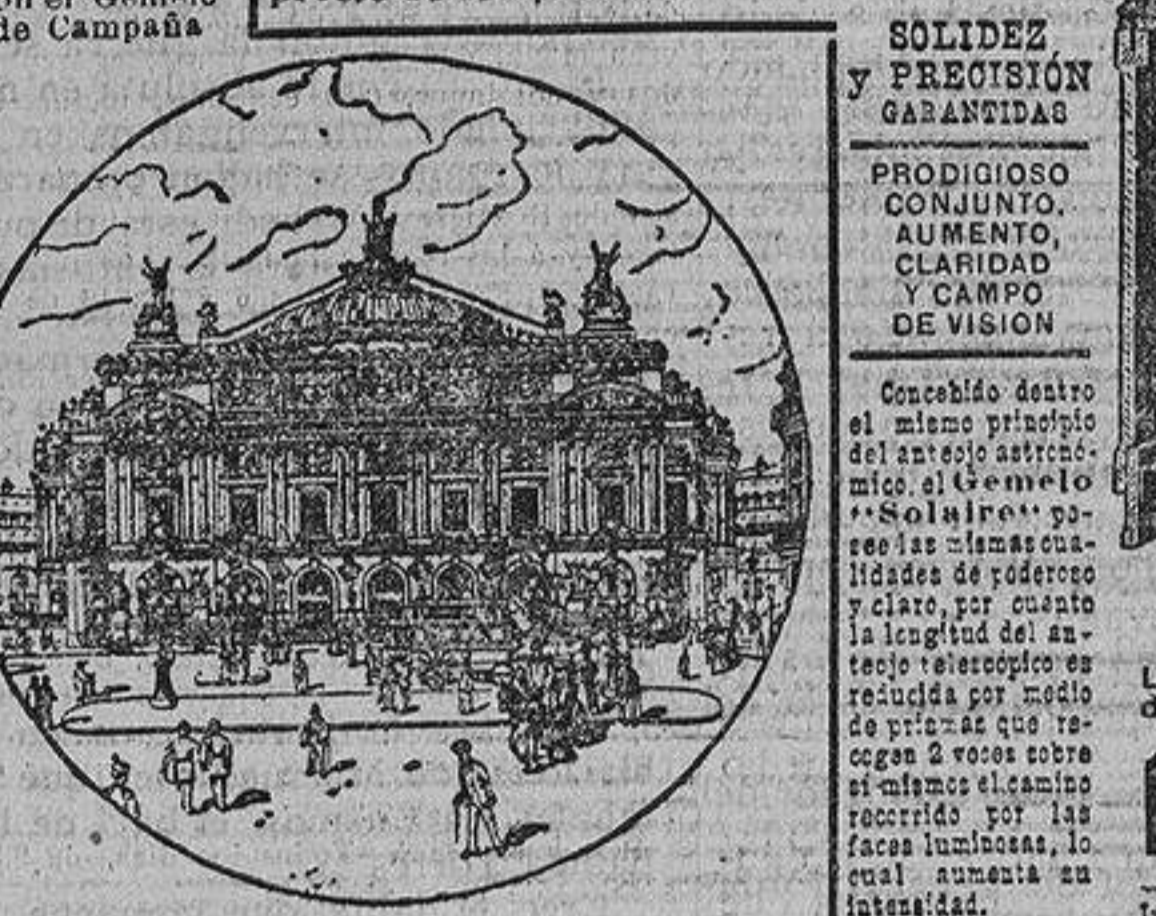
Campo de visión con nuestros Gemelos TELE-STÉREO PRISMÁTICOS, ó sea 8 veces mayor