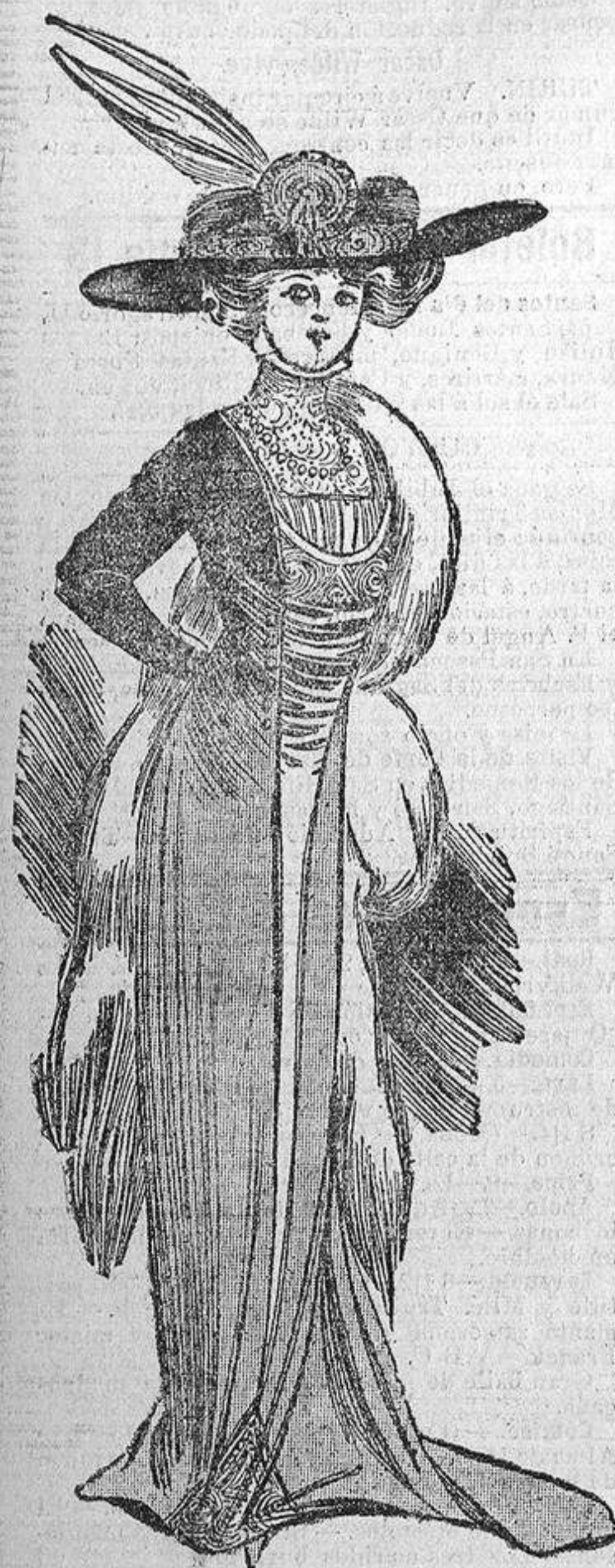
Modelo recientísimo de vestido para visitas, paseos en coche y recepciones de tarde.

20 PESETAS DE GRATIFICACION se darán al que presente, calle de la Libertad, 10, un perro que atienda por Sufián; tiene una herida encima del cuello. Mas señas: grande, pelo largo blanco, orejas y manchas, color café. Extraviado día 2 noche.