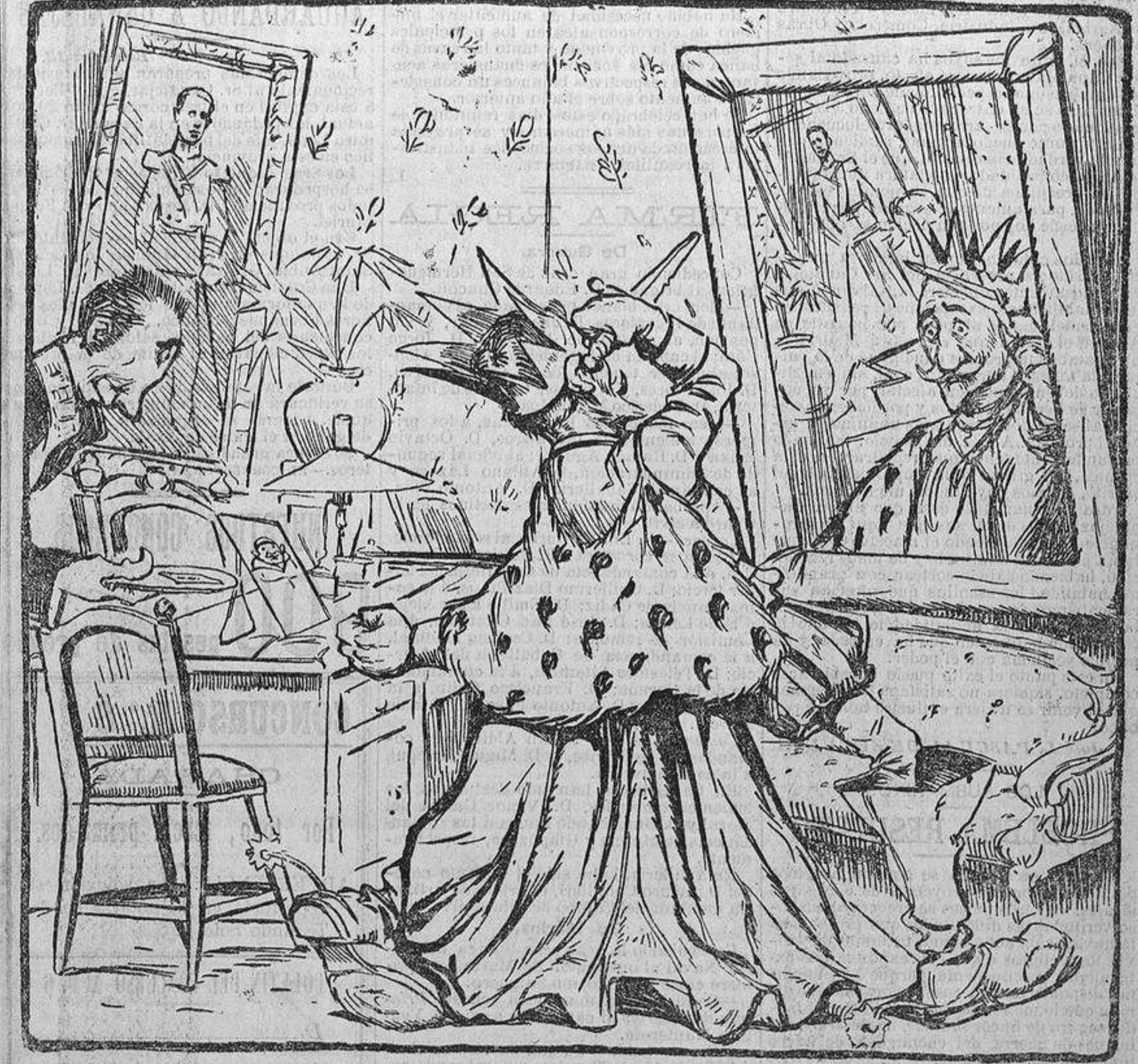
UN PORTERO.—Señor: una numerosa Comisión de cómicos desea ser recibida por S. E. para entregarle el nombramiento de comediante mayor del Reino.

de reconocer que la situación es hoy mejor que desde hace mucho tiempo.