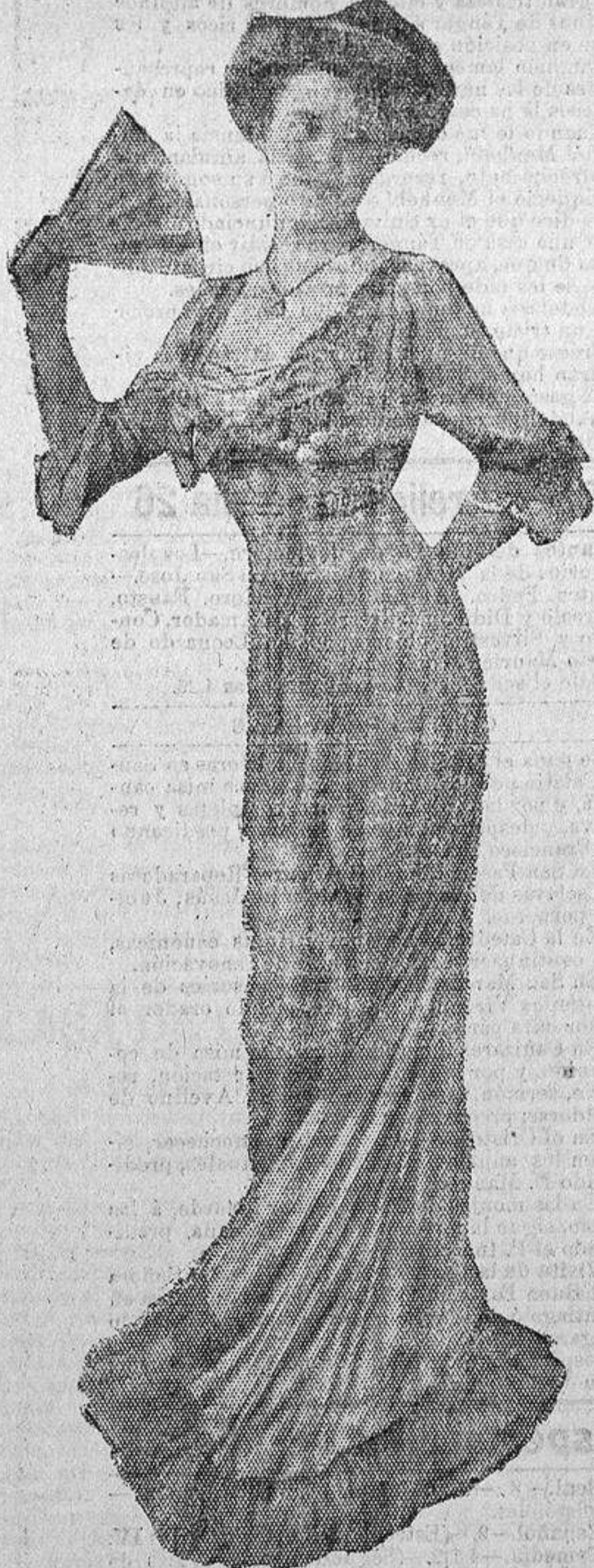
VESTIDOS DE COMIDA Y BAILE Seda de China con fleco y volante de lo mismo.