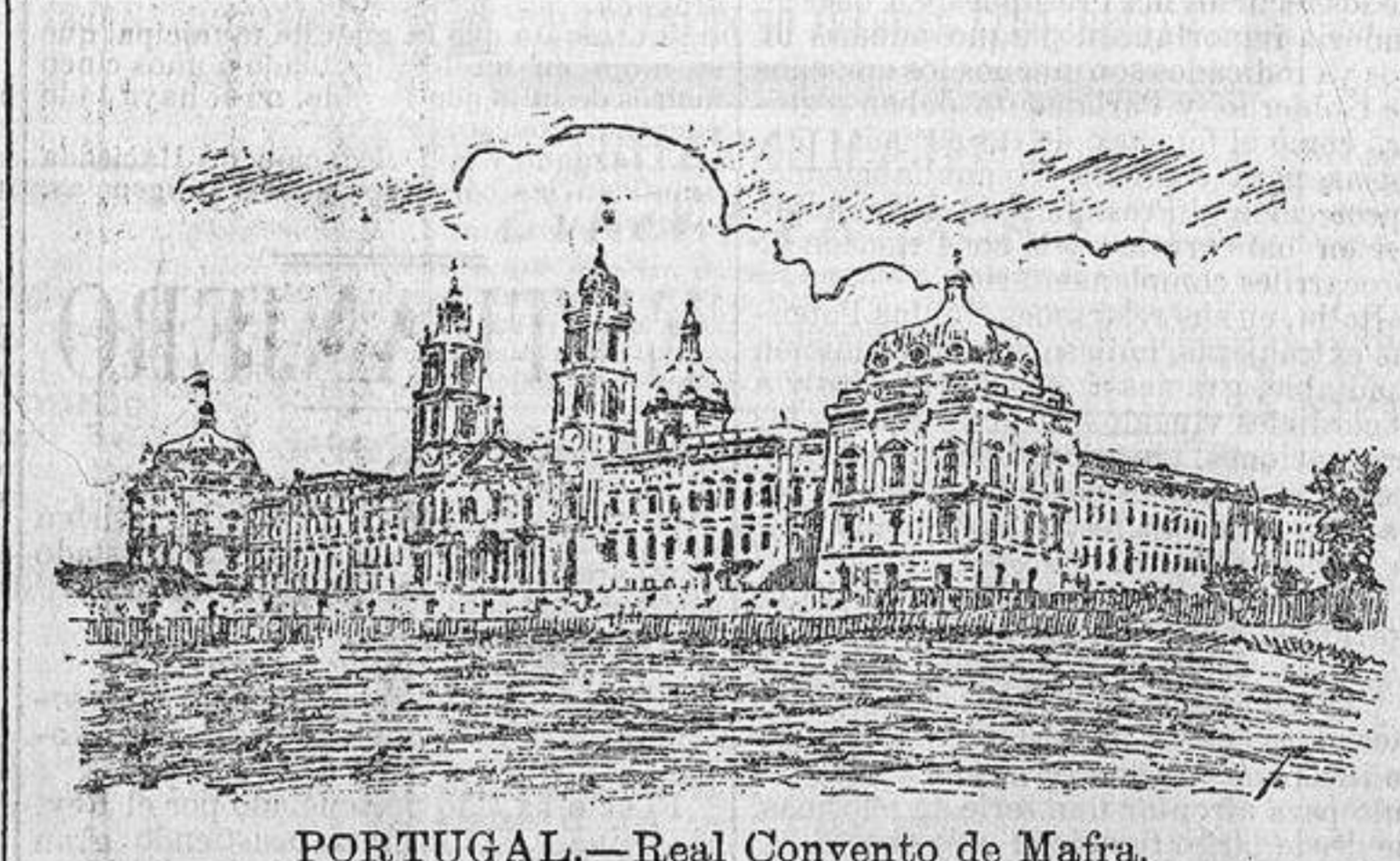
PORTUGAL.—Real Convento de Mafra.

La impresión que nuestros lectores sacarán de las anteriores líneas, es la de que por ahora no habrá que pensar en proyecto de subvención de capitalidad, toda vez que el Gobierno lo relega á segundo término, aunque no sería de extrañar cualquier actitud que se adoptara por determinados elementos en favor de su aprobación.