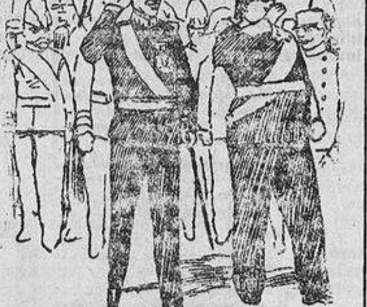
LISBOA.—Llegada de Alfonso XIII

andaluces, por donde, solo y pobre y soñador, un triste gañán se duele, entre sentidas malagueñas... Yo soy como el árbol solo que está en medio del camino. No tengo padre ni madre. ¡Matillo sea mi sino! La escuadra inglesa, fuerte, poderosa y temible, fondea soberbiamente en el Tajo. Lisboa, como una flor del Harén, se atavía para aclamar á Eduardo VII. En nuestro Parlamento, Combes es un Dios; en nuestro teatro, el audenille es rey; en nuestra Prensa, París es el clou ; en nuestras librerías, no hay más que libros franceses. Londres es el señor feudal de Lisboa: París el dueño de Madrid. ¡Ya está, ya está explicado el fenómeno inexplicable! Pero ¡ah! que todavía, en las noches del Tajo, sobre los gallardetes de la escuadra inglesa, por encima del arrogante pabellón azul, señorease, doliente y nostálgico y clamoroso, el fado portugués... Cuervos de cerdura brian os campos frescos. Y todavía, debajo del costoso abrigo parisién, el corazón de una marquesa sevillana late pronto y romántico cuando escucha el sollozo de esta copla: Yo soy como el árbol solo que está en medio del camino... Cristóbal DE CASTRO.