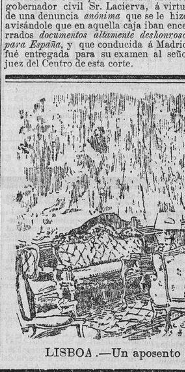
LISBOA.—Un aposento del Palacio das Necesidades.

sencilla y convincente. Que en España, las casas editoriales no pagan la producción intelectual, pues notorio es que se reducen á comerciar con ella usuriamente. Y hecha esta rápida exposición de indispensables antecedentes, paso á exponer el brutal atropello á que ellos se contraen. Sabido es, por haberlo hecho público toda la Prensa, que la caja en que yo enviaba mis cuartillas á Buenos Aires, fué detenida en Cádiz por orden del entonces gobernador civil Sr. Lacierva, á virtud de una denuncia anónima que se le hizo, avisándole que en aquella caja iban encerrados documentos altamente deshonrosos para España, y que conducida á Madrid, fué entregada para su examen al señor juez del Centro de esta corte.