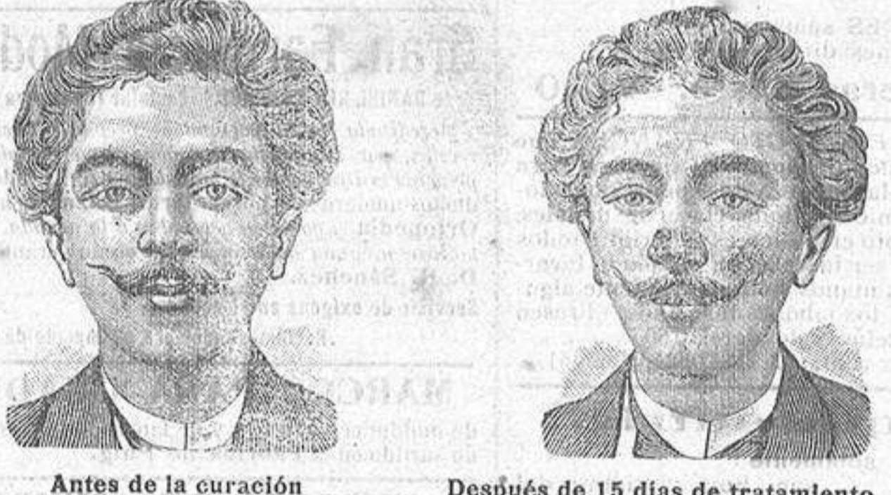
Antes de la curación Después de 15 días de tratamiento