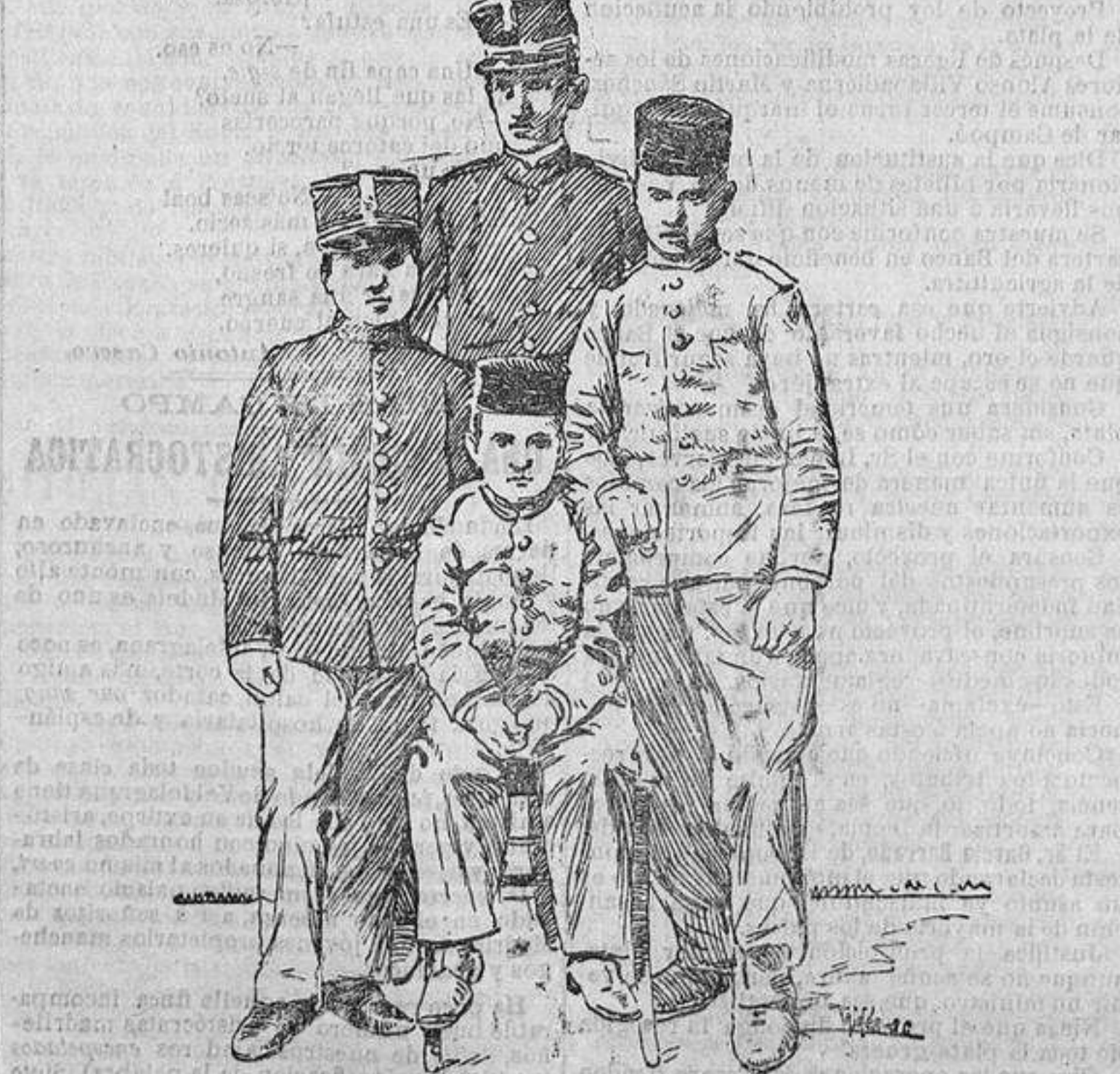
Grupo de huérfanos de la guerra.

Se ignora el origen de los instigadores del tumulto.