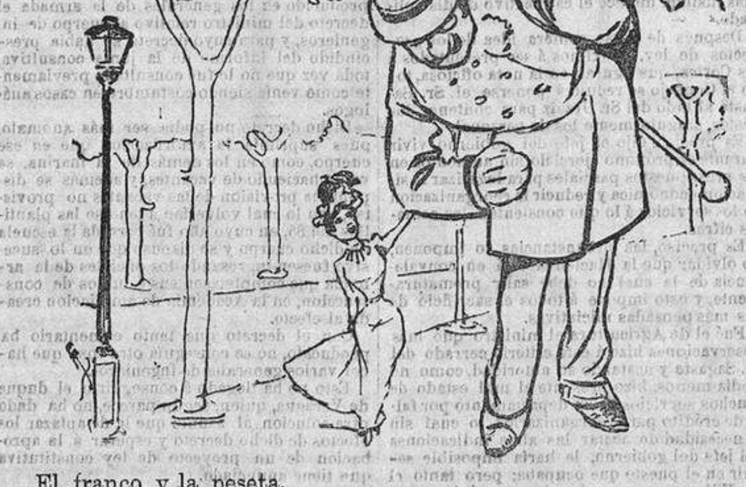
El franco y la peseta.