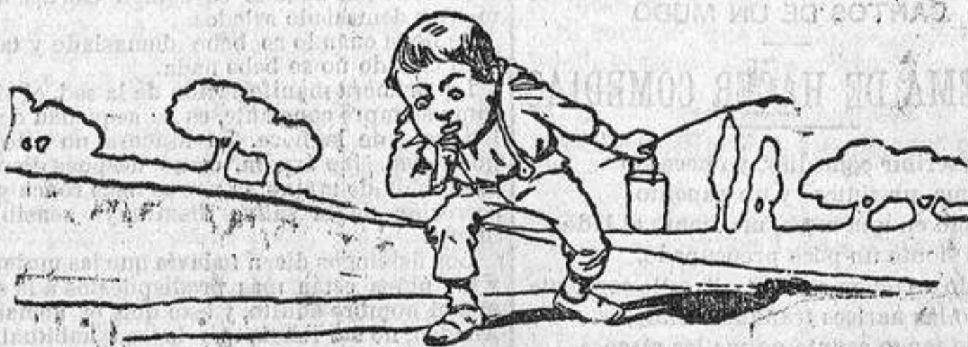
—¡Anda la órdira! ¡por aquí canta uno!