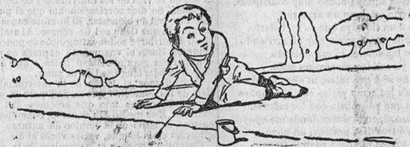
—¡Pa chasco que se haya escapao!