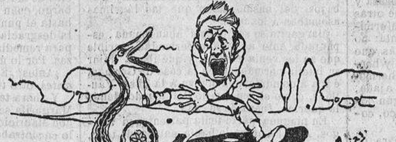
—¡Jesús, María y José!