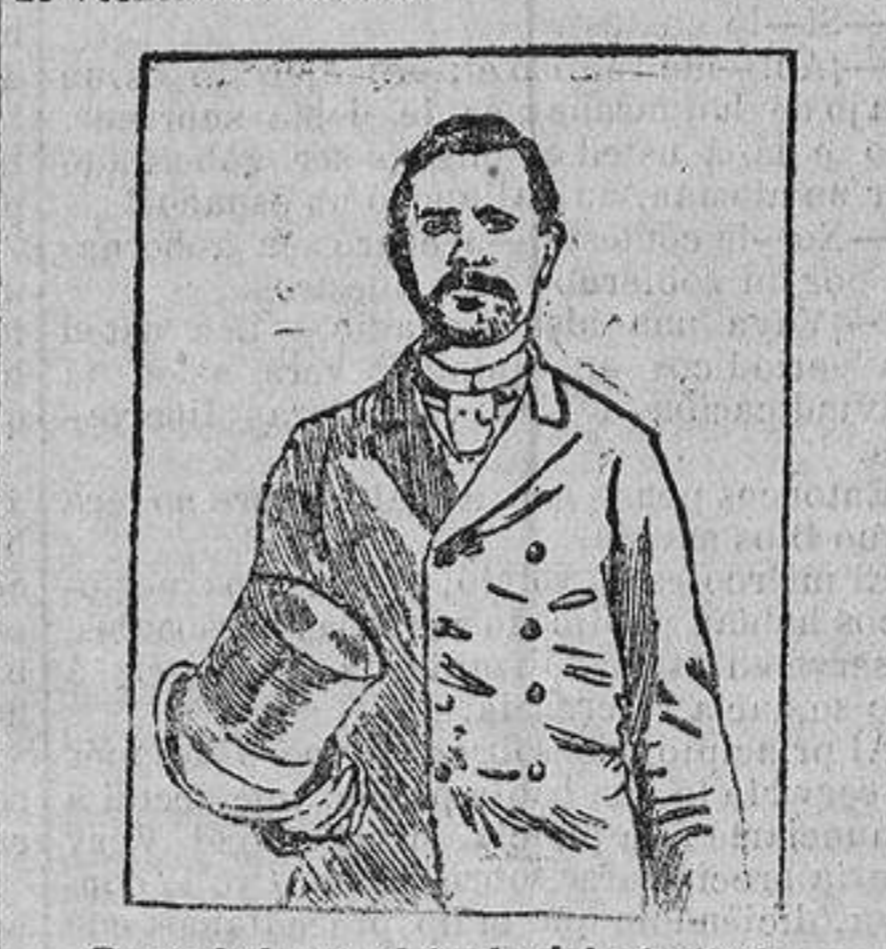
Ravachol con el traje del atentado.

comedor en el momento de la explosión. La araña se desprendió, pasando a quince centímetros de su cabeza. En cuanto a las pérdidas materiales que ha tenido, no bajarán de veinte mil francos.