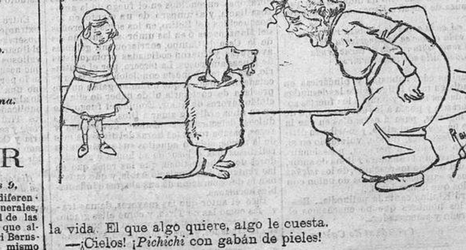
la vida. El que algo quiere, algo le cuesta.