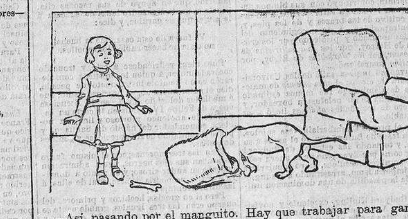
—Así, pasando por el manguito. Hay que trabajar para ganarse