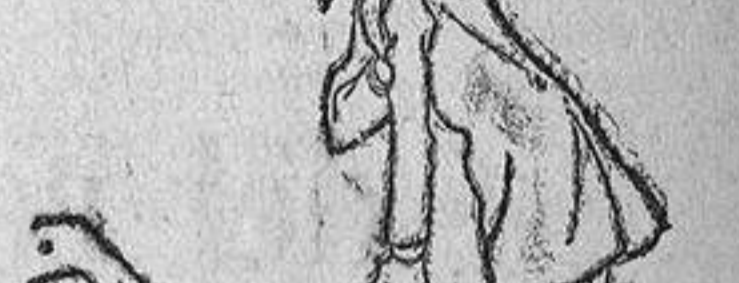
Ante el gobernador.