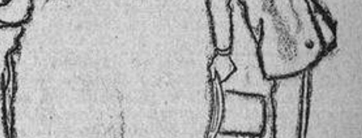
Ante el elector.