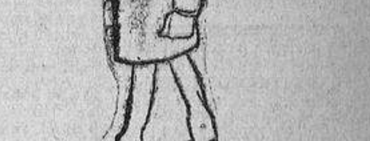
En donde no caben siete se empujan al señor cecilio; y es claro, se arma la gorra siempre que se sienta un gordo.