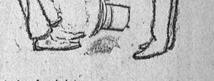
Ante el ministro.

FLEXIONES ELECTORALES. Estudio de actualidad.