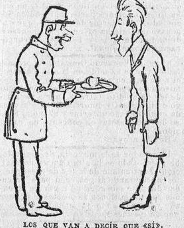
LOS QUE VAN A DECIR QUE «SÍ»