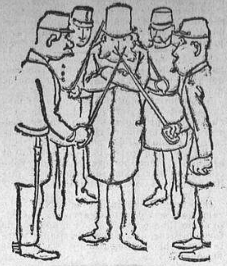
LOS QUE VAN A DECIR QUE «NO»