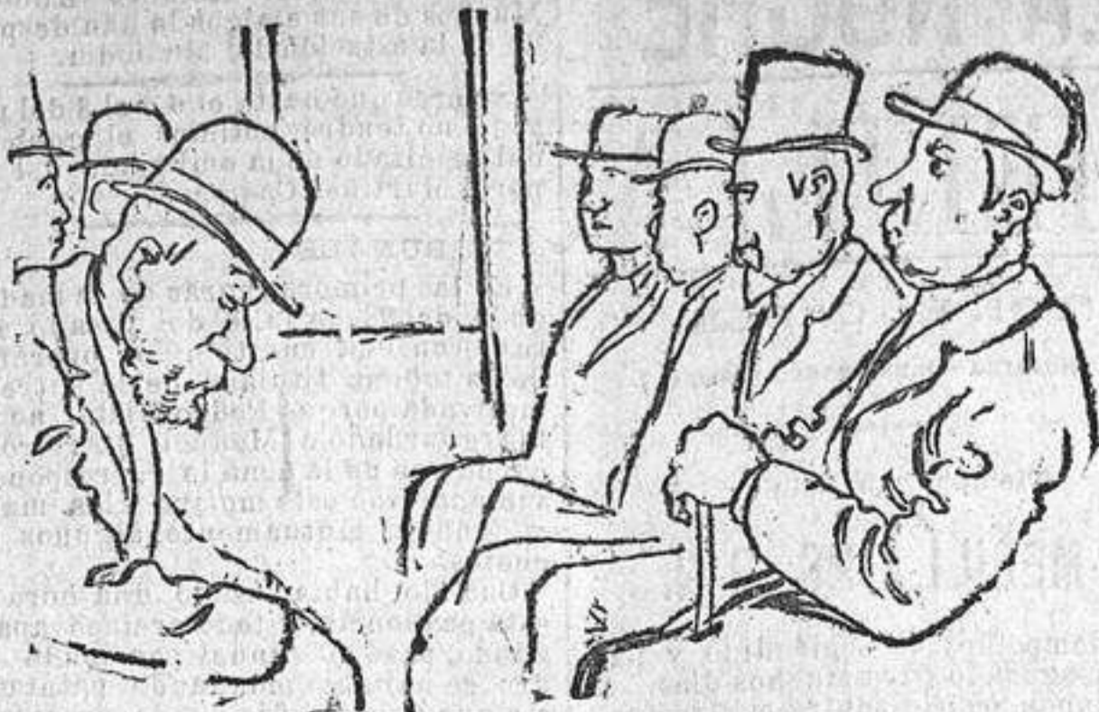
De orden de la autoridad se prohibe fumar en el interior de los tranvías.

Solución a la anterior: ABECÉ. ESPECTÁCULOS PARA EL DÍA 30. TEATRO REAL. ESPAÑOL. PRINCESA. COMEDIA. ZARZUELA.