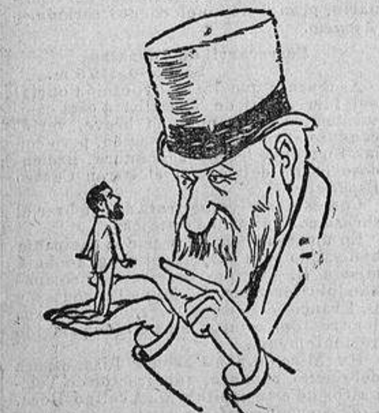
CHILE Y LOS ESTADOS UNIDOS MICROMEAS. HARRISON.—¡Vamos á discutir lo del Baltimore!