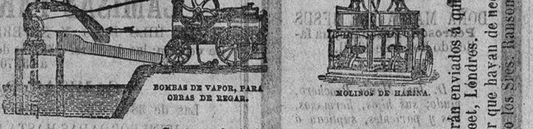
BOMBAS DE VAPOR, PARA OBRAS DE REGAR.