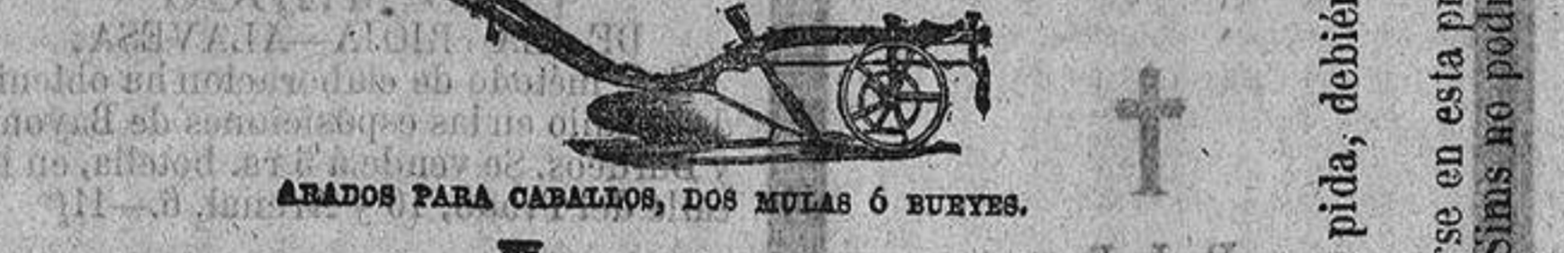
ARADOS PARA CABALLOS, DOS MULAS Ó BURYES.