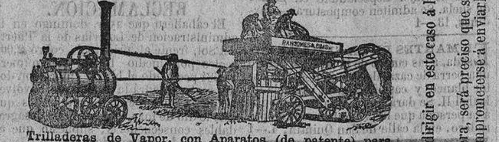
Trilladoras de Vapor, con Aparatos (de patente) para despedazar y machacar la paja.

ORWELL WORKS, IPSWICH, INGLATERRA; 9, GRACECHURCH STREET, LONDRES.