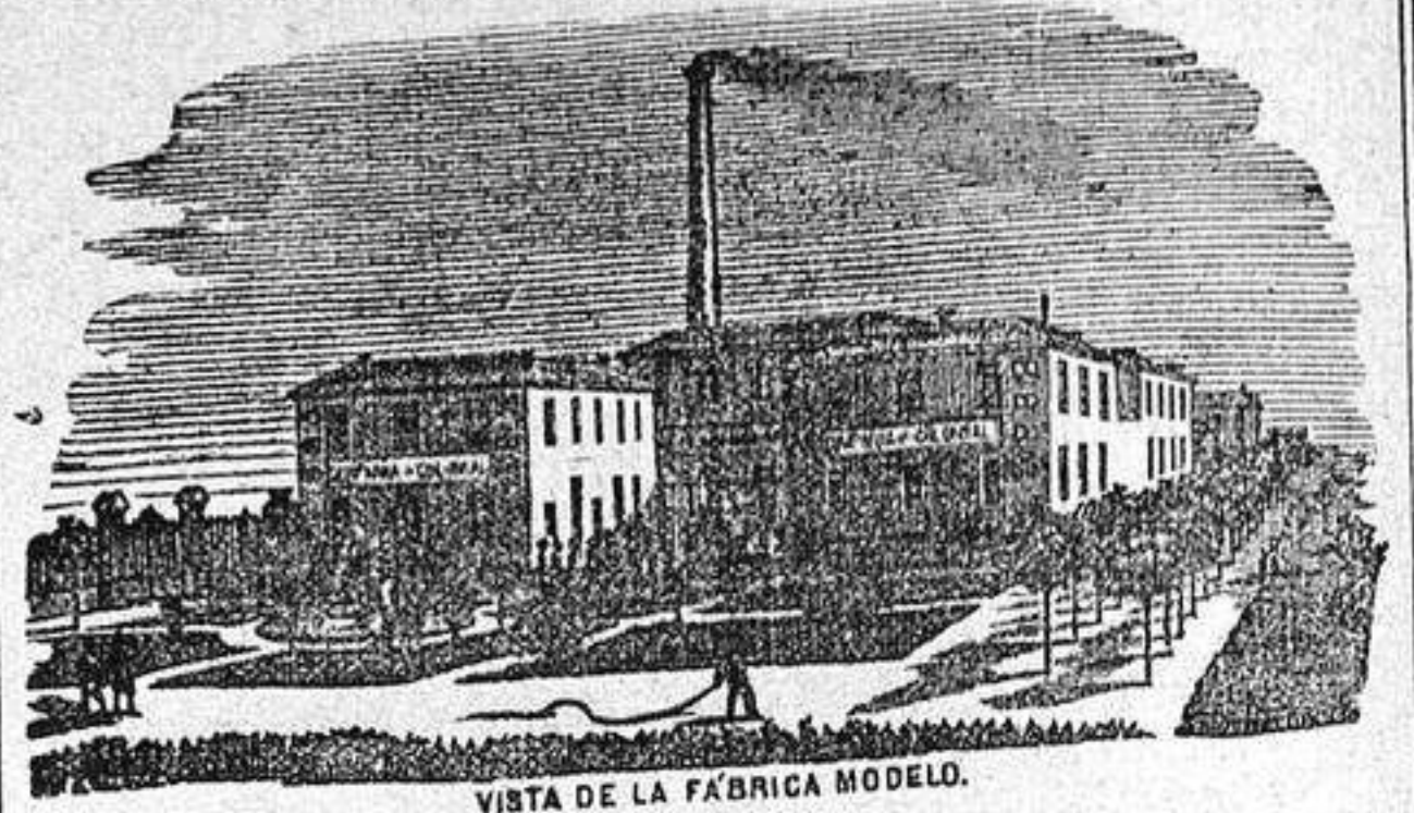
VISTA DE LA FABRICA MODELO.