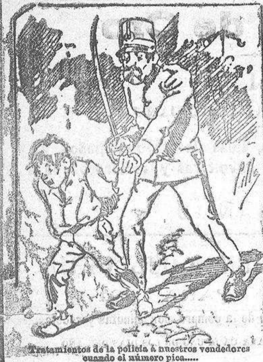
Tratamientos de la polio á nuestros vendedores cuando el número pica.....