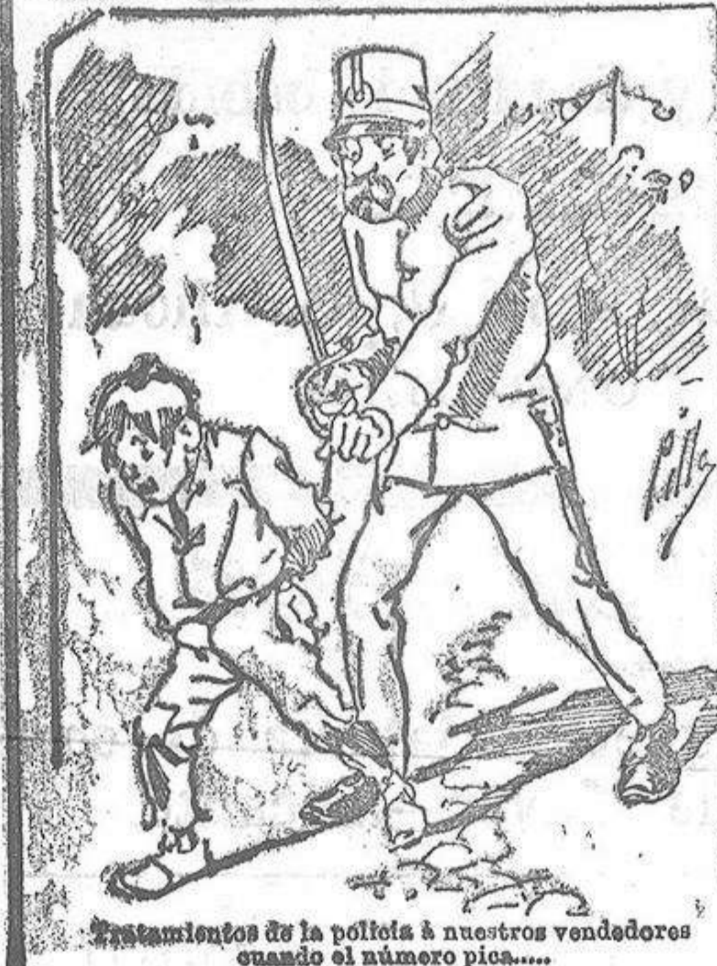
Entusiasmos de la pollita á nuestros vendedores cuando el número pica.....

También puede pedirse LA AVISPA y el CATALOGO RESERVADO en casa de nuestros corresponsales autorizados, si no se quiere escribir á la Administración.