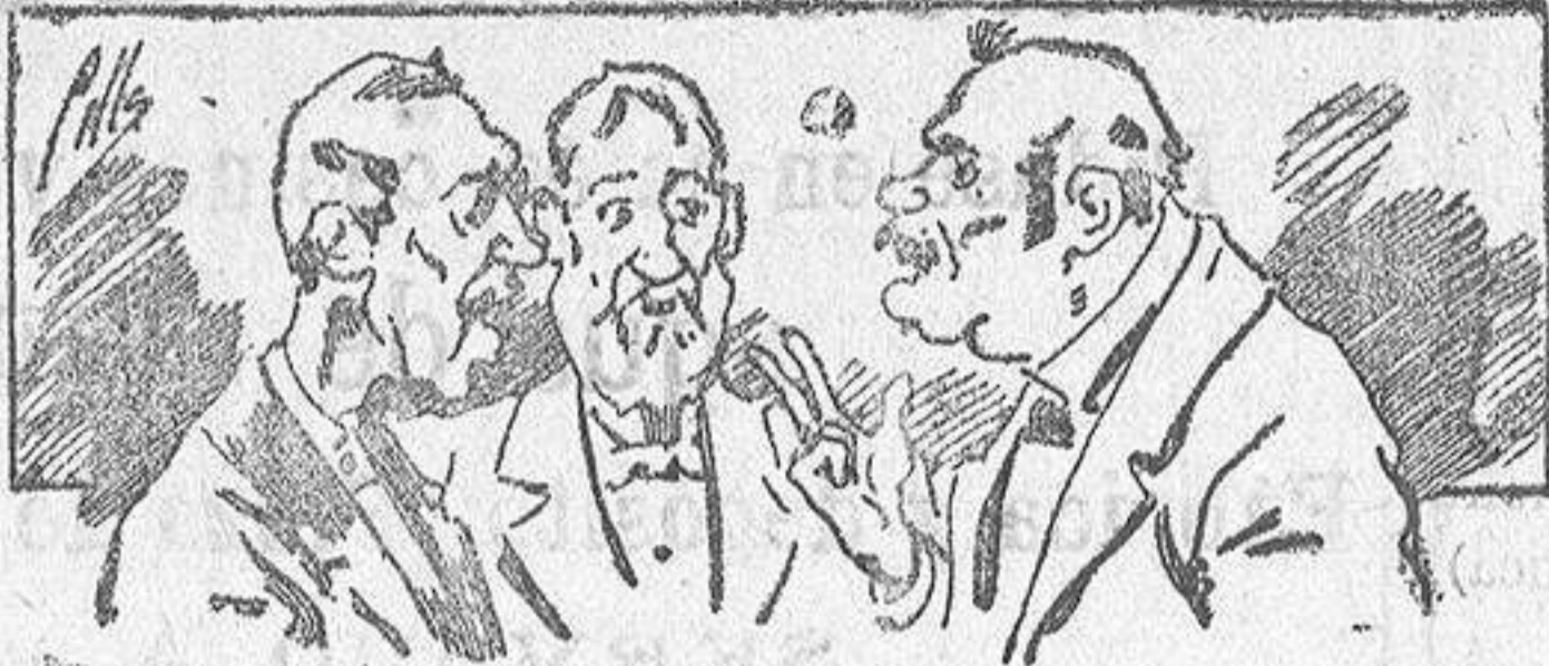
Abominan á nuestros libros..... pero los compran.

ser beneficiosos. Cuenta además con buenos grabados, parte literaria excelente; da regalos mensuales á sus lectores con la Lotería Nacional y participaciones en la misma, á cuyo efecto compra todos los sorteos, y en una de las Administraciones más afortunadas por la suerte, billetes enteros. La suscripción y los números que se nos pidan se sirven gratuitamente á correo vuelto y franqueados, con sólo indicar el nombre y dirección del que lo desea en sobre dirigido al Sr. Administrador de