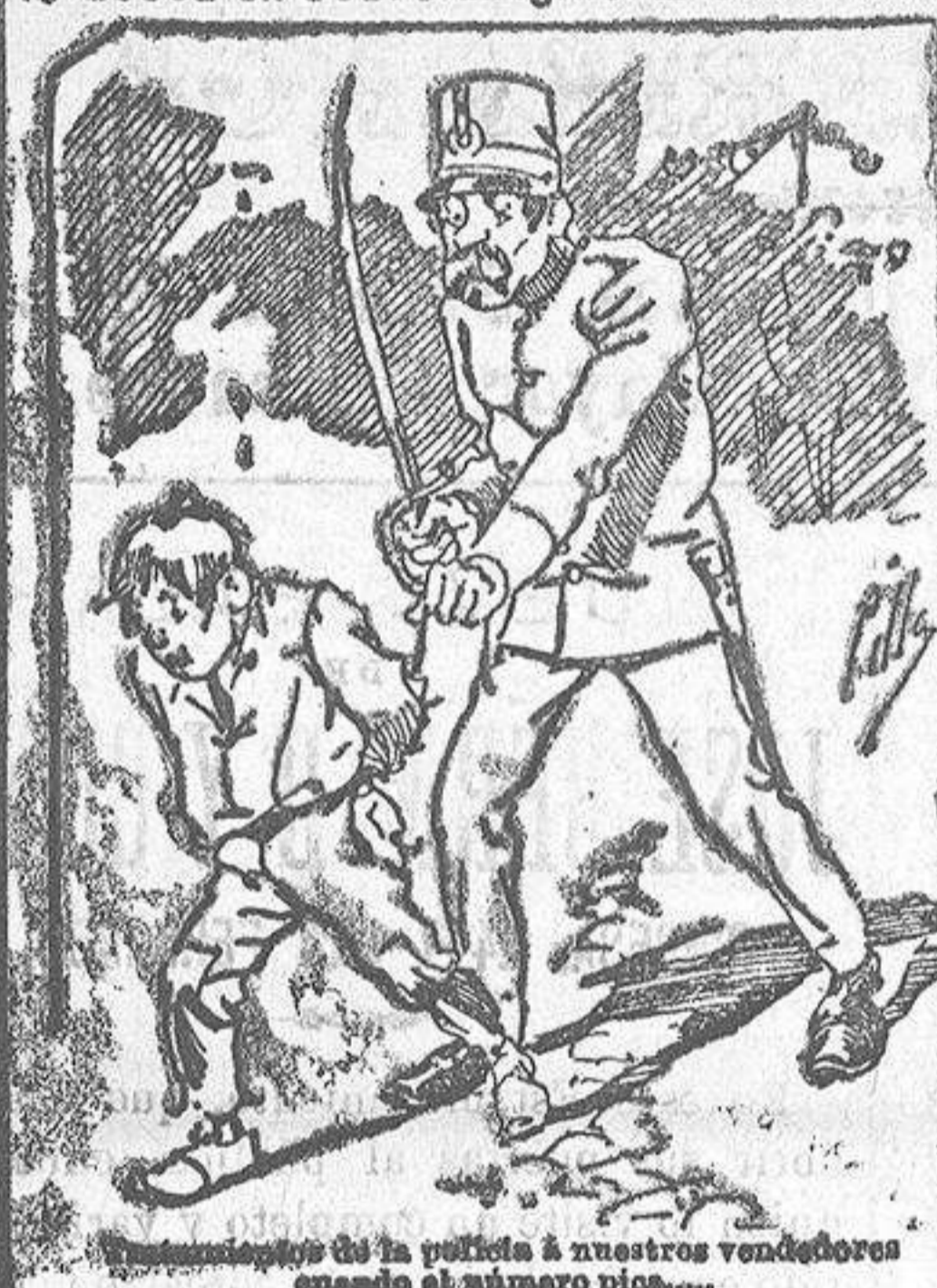
Comunicación de la policía á nuestros vendedores cuando el número pide....

También puede pedirse LA AVISPA y el CATALOGO RESERVADO en casa de nuestros corresponsales autorizados, si no se quiere escribir á la Administración.