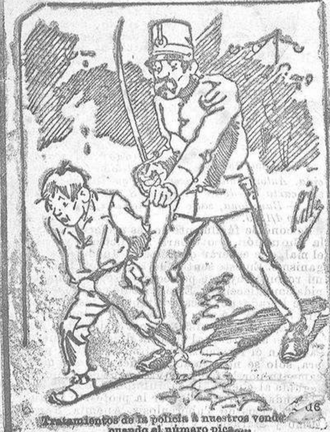
Tratamiento de la policía á nuestros vendedores cuando el número pica...