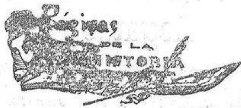
Batalla naval de Barcelona.—9 de Junio de 1359.

El Diario de la Marina de la Habana y Las Efemérides de Canarias han iniciado suscripciones populares en las que figuran entre los españoles suscriptos buen número de extranjeros, publicando el primero de los citados diarios una expresiva carta del hoy general cubano Quintín Banderas en la que hace nobles manifestaciones de elogio á Vara de Rey y á sus soldados, y hace presente que una vez terminada la lucha, todos deben contribuir á esa obra de justicia.