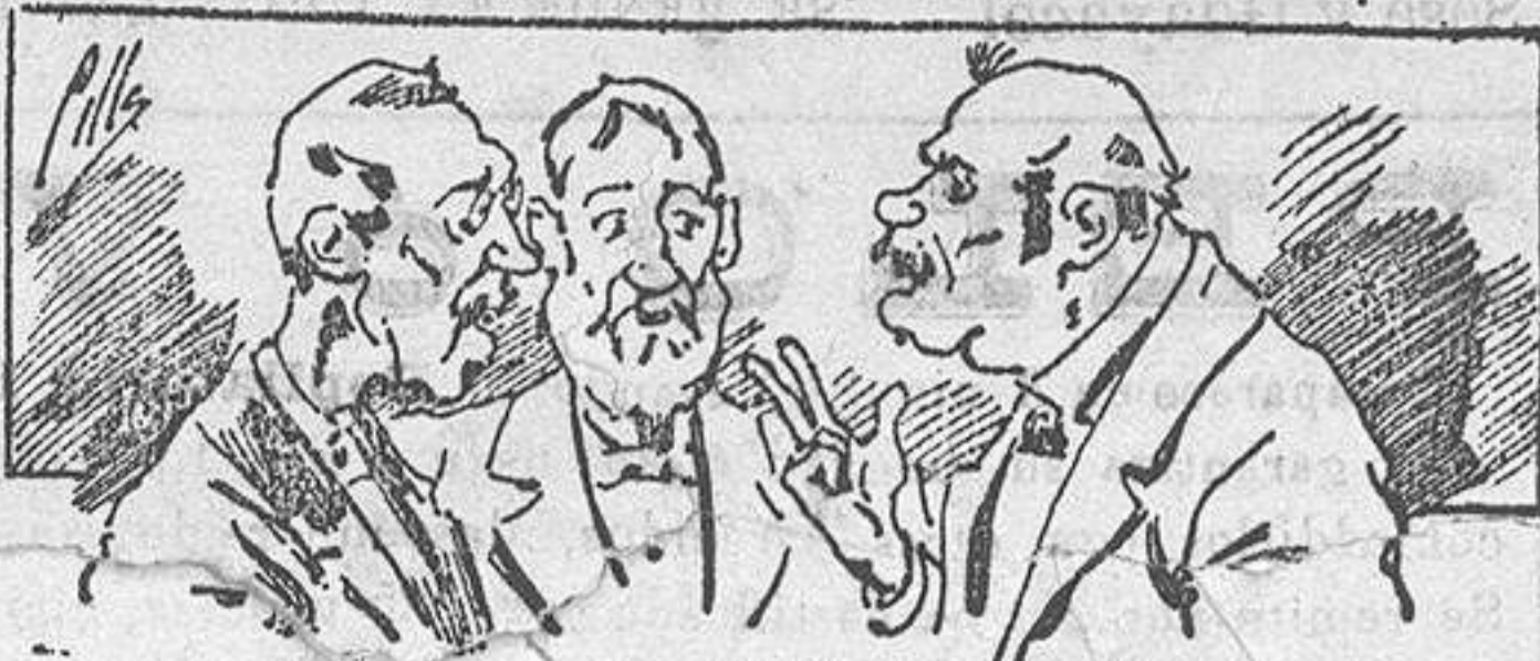
Aboninan á nuestros libros... pero los compran.

Todas las personas de gusto, curiosas e ilustradas deben pedir al Director de LA AVISPA, apartado núm. 8, MADRID, un ejemplar que se remite gratis y franqueado. Esta Revista Enciclopédica Popular publica recreaciones científicas, recetas de cocina, repostería, confitería, vinos, licores, pinturas, barnices, betunes y fórmulas para toda clase de industria, y cuantas noticias y conocimientos puedan ser beneficiosos. Cuenta además con buenos grabados, parte literaria excelente; da regalos mensuales á sus lectores con la Lotería Nacional y participaciones en la misma, á cuyo efecto compra todos los sorteos, y en una de las Administraciones más afortunadas por suerte, billetes enteros. La suscripción y los números que se nos pidan se sirven gratuitamente á correo vuelto y franqueados, con sólo indicar el nombre y dirección del que se suscribe en sobre dirigido al Sr. Administrador de