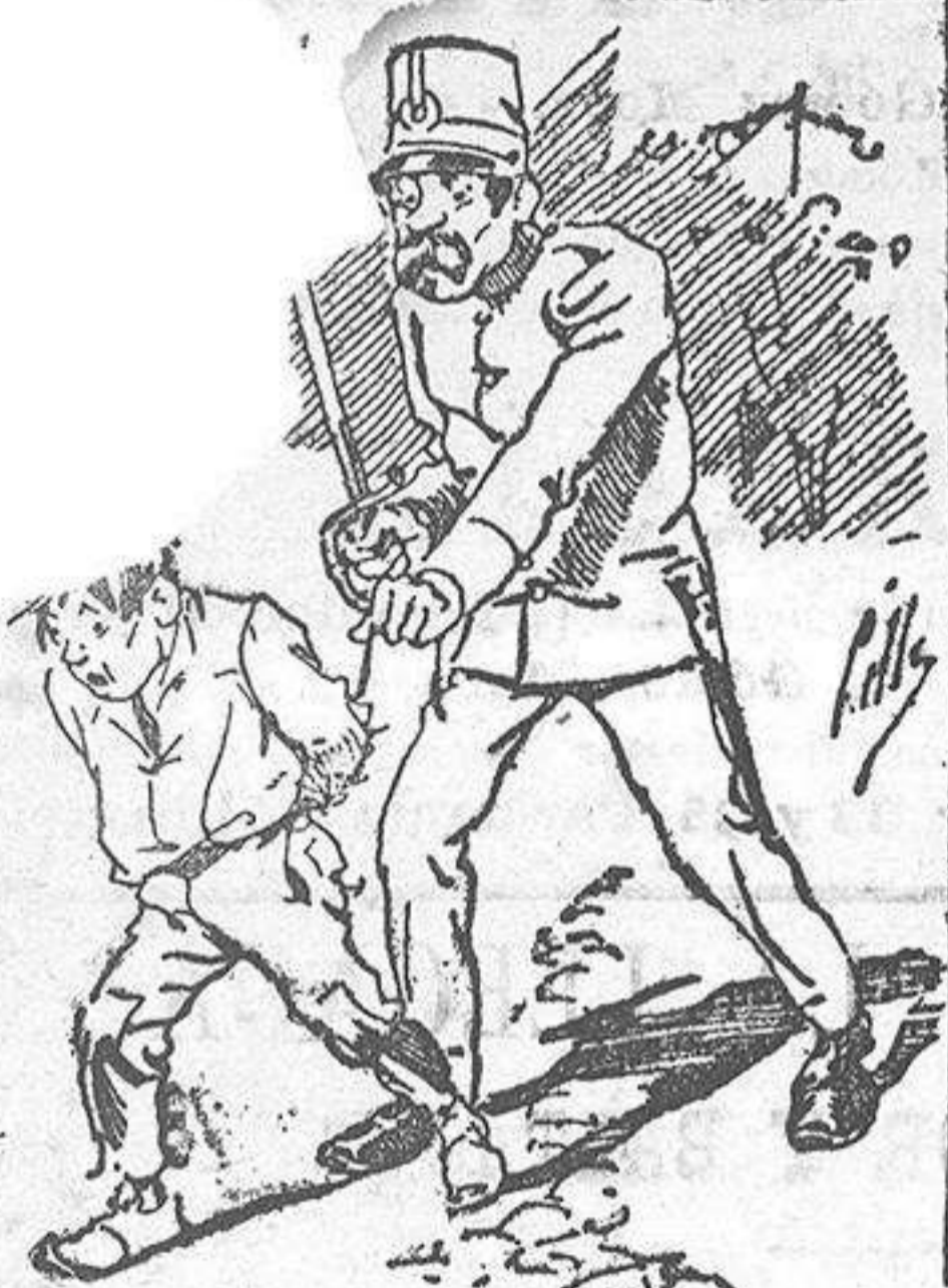
Tratamientos de la policía á nuestros vendedores cuando el número pica...

También puede pedirse LA AVISPA y el CATALOGO RESERVADO en casa de nuestros corresponsales autorizados, el no se quiere escribir á la Administración.