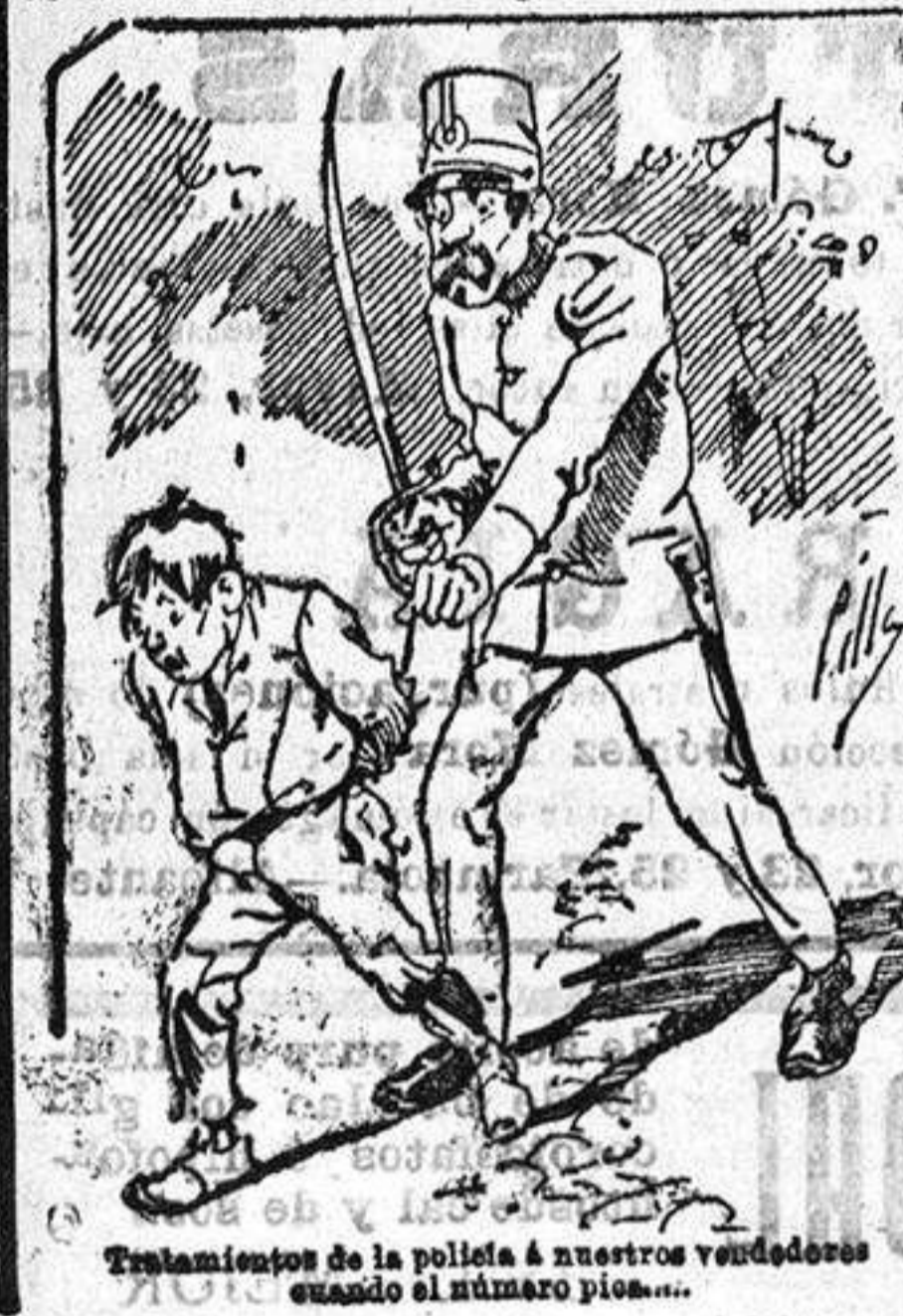
Tratamiento de la polioxa á nuestros verdaderos cuando el número pisa...