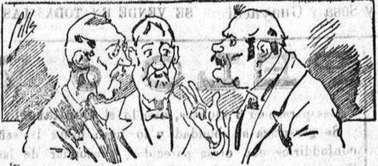
Abominan á nuestros libros... pero los compran.

Todas las personas de gusto, curiosas e ilustradas deben pedir al Director de LA AVISPA, apartado núm. 8, MADRID, un ejemplar que se remite gratis y franqueado. Esta Revista Enciclopédica Popular publica recreaciones científicas, recetas de cocina, repostería, confitería, vinos, licores, pinturas, barnices, betunes y fórmulas para toda clase de industria, y cuantas noticias y conocimientos puedan ser beneficiosos. Cuenta además con buenos grabados, parte literaria excelente; da regalos mensuales á sus lectores con la Lotería Nacional y participaciones en la misma, á cuyo efecto compra todos los sorteos, y en una de las Administraciones más afortunadas por la suerte, billetes enteros. La suscripción y los números que se nos pidan se sirven gratuitamente á correo vuelto y franqueados, con sólo indicar el nombre y dirección del que lo desea en sobre dirigido al Sr. Administrador de