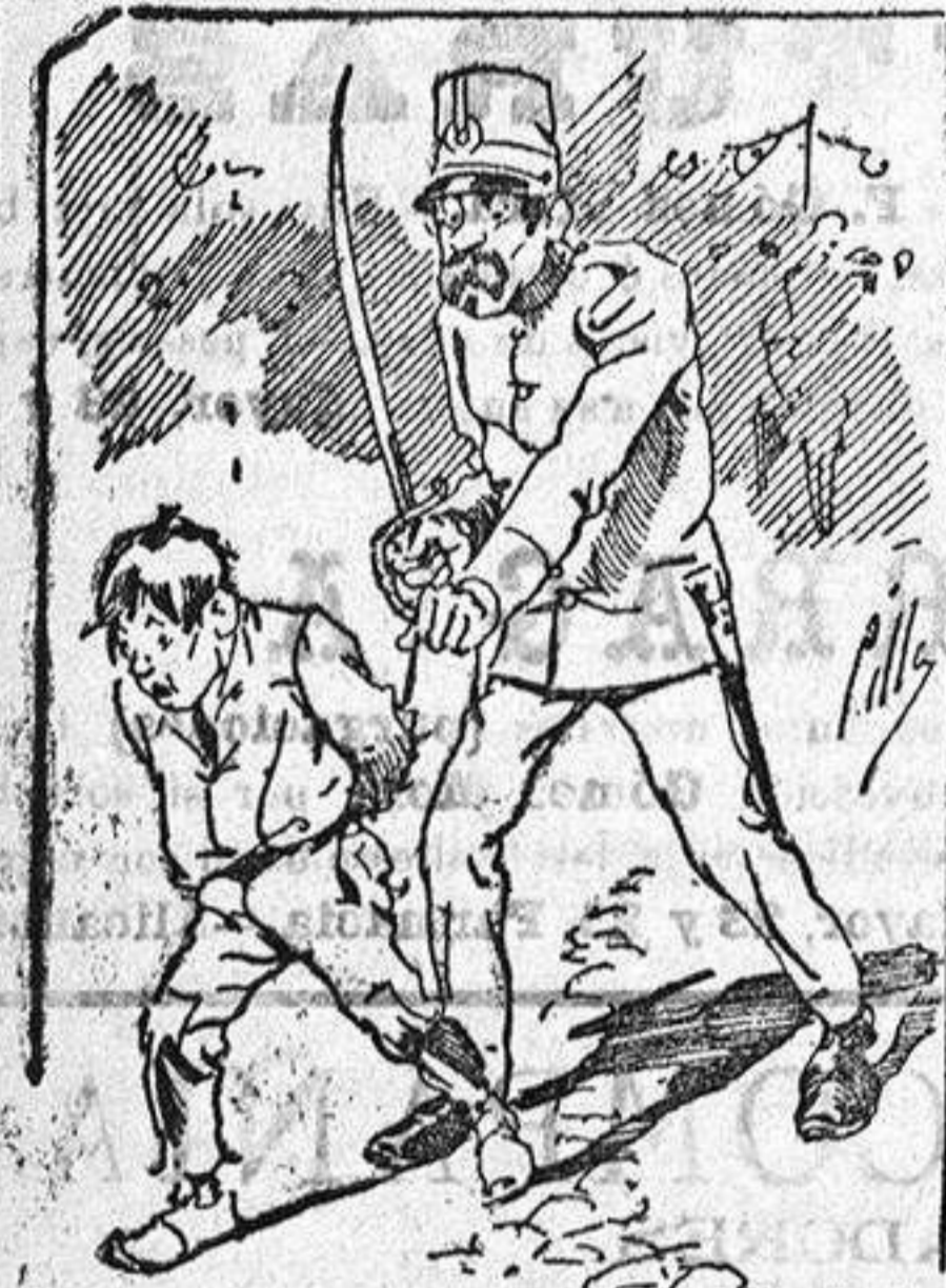
Tratamientos de la polioa á nuestros vendedores cuando el número pica...