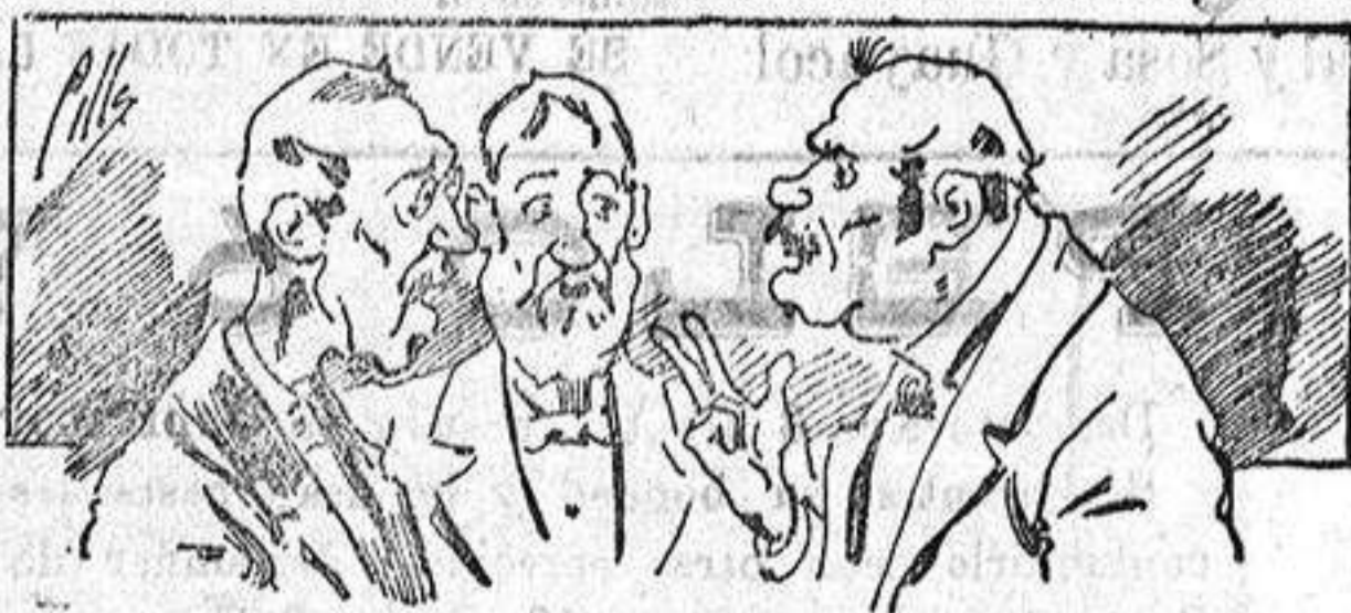
Abominan á nuestros libros..., pero los compran.

Todas las personas de gusto, curiosas é ilustradas deben pedir al Director de LA AVISPA , apartado núm. 8, MADRID, un ejemplar que se remite gratis y franqueado. Esta Revista Enciclopédica Popular publica recreaciones científicas, recetas de cocina, repostería, confitería, vinos, licores, pinturas, barnices, betunes y fórmulas para toda clase de industria, y cuantas noticias y conocimientos puedan ser beneficiosos. Cuenta además con buenos grabados, parte literaria excelente; da regalos mensuales á sus lectores con la Lotería Nacional y participaciones en la misma, á cuyo efecto compra todos los sorteos, y en una de las Administraciones más afortunadas por la suerte, billetes enteros. La suscripción y los números que se nos pidan se sirven gratuitamente á correo vuelto y franqueados, con sólo indicar el nombre y dirección del que lo desea en sobre dirigido al Sr. Administrador de