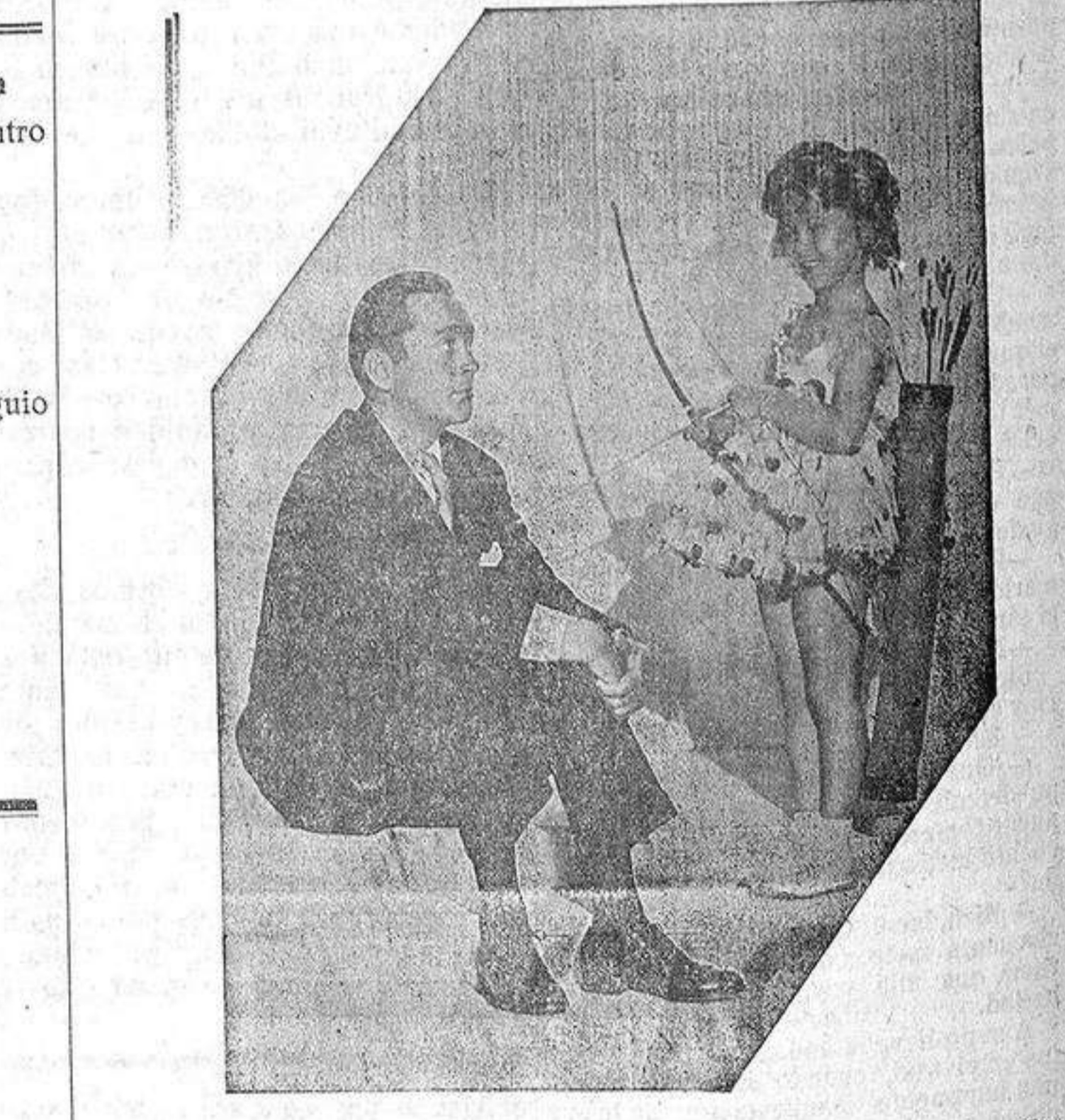
Shirley Temple y James Dunn, los inolvidables intérpretes de «Gracia y Simpatía» y «Ojos Cariñosos», ambas de la Fox, en una graciosa posse