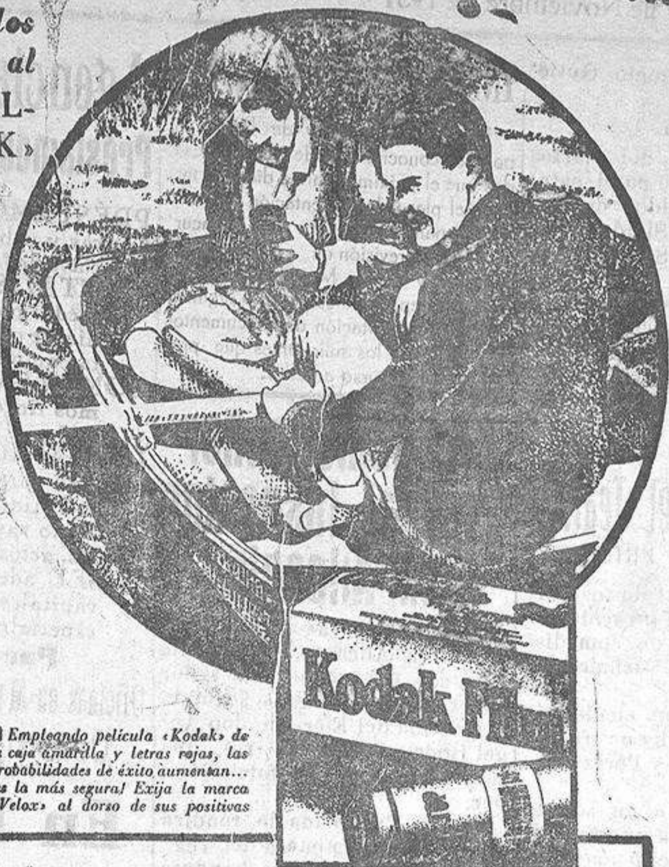
■ Empleando película «Kodak» de la caja amarrilla y letras rojas, las probabilidades de éxito aumentan... sea la más segura! Exija la marca «Velox» al dorso de sus positivos

■ No hace falta usar aparatos costosos ni complicados; puede usted servirse del más sencillo «Brownie» o «Kodak» cuyo fácil manejo aprenderá en sólo unos minutos