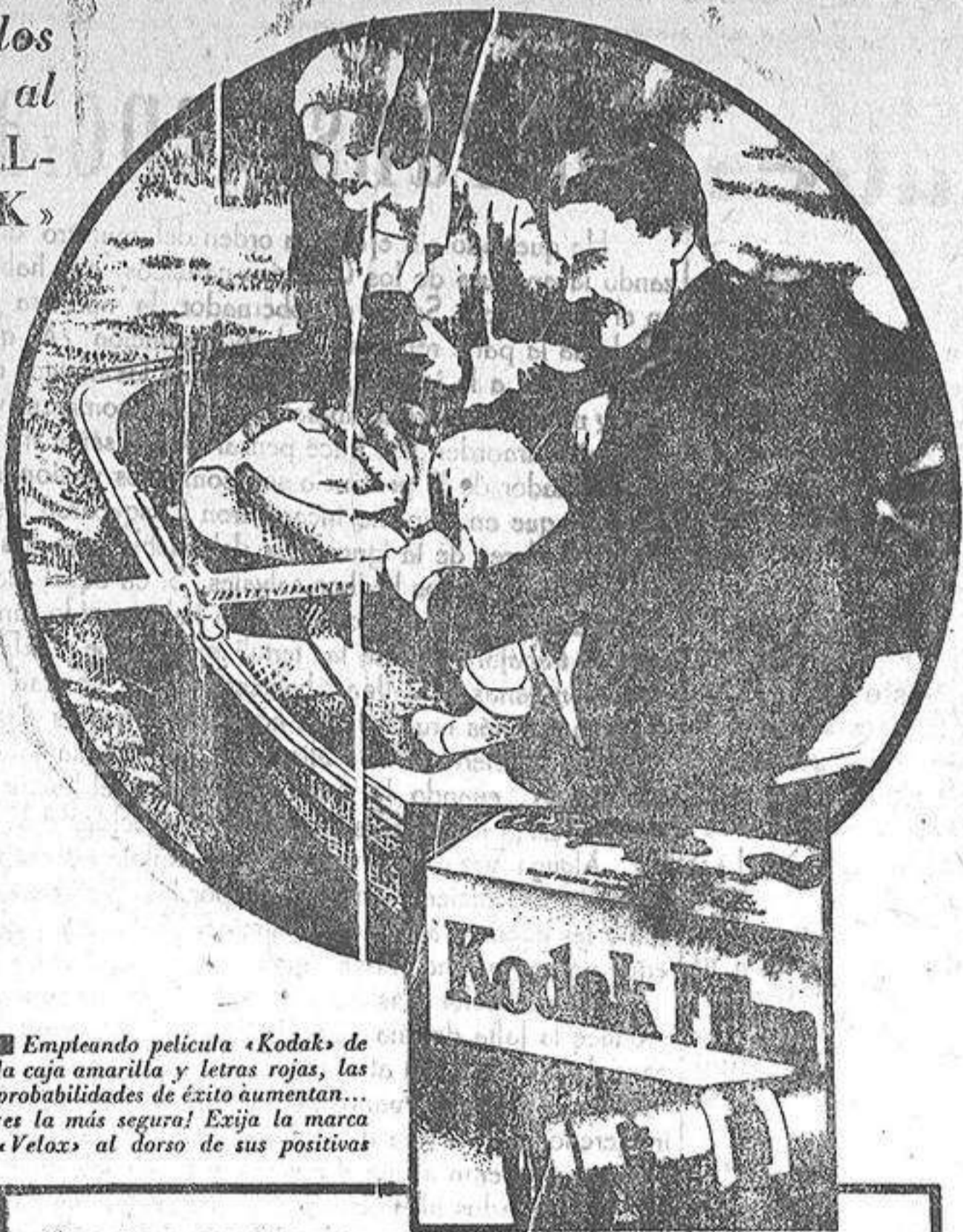
Empleando película «Kodak» de la caja amarilla y letras rojas, las probabilidades de éxito aumentan... ¡es la más segura! Exija la marca «Velox» al dorso de sus positivos.

No hace falta usar aparatos costosos ni complicados; puede usted servirse del más sencillo «Brownie» o «Kodak» cuyo fácil manejo aprenderá en sólo unos minutos.