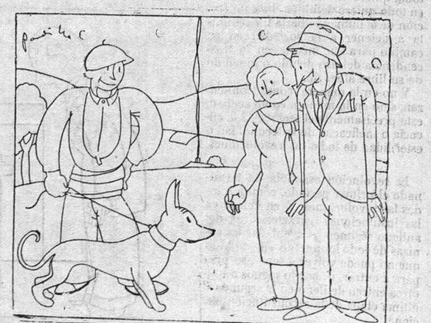
— Y este perro, ¿deja que se acerquen a él? ¡Anda, ya lo creo! Sino ¿cómo iba a poder andar?