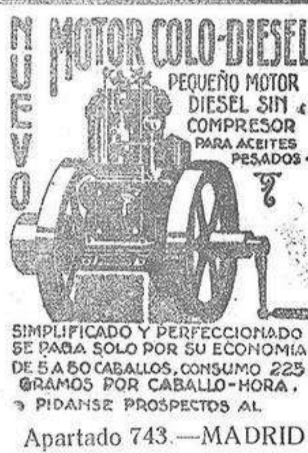
MOTOR COLO-DIESEL. PEQUEÑO MOTOR DIESEL SIN COMPRESOR PARA ACEITES PESADOS. SIMPLIFICADO Y PERFECCIONADO SE PAGA SOLO POR SU ECONOMIA DE 5 A 60 CABALLOS, CONSUMO 225 GRAMOS POR CABALLO-HORA. PIDANSE PROSPECTOS AL Apartado 743.-MADRID

Aparato de ondulación permanente, el modelo más perfeccionado de la casa GALLIA con su Ruptor de seguridad. El que hace las ondas más artísticas y duraderas, como mínimo un año (se pueden indicar servicios realizados con este aparato, que es la mejor garantía), Bienes inofensivos, los que emplean en los más importantes salones de París, 24 colores diferentes garantizando absolutamente su resultado. Especialistas para el corte de pelo y ondulación Marcel. Dichos trabajos están a cargo de señoras. RODRIGUEZ, Altamira, 14, 1. Esta casa ha creado una sección económica y servicio a domicilio consulten precios