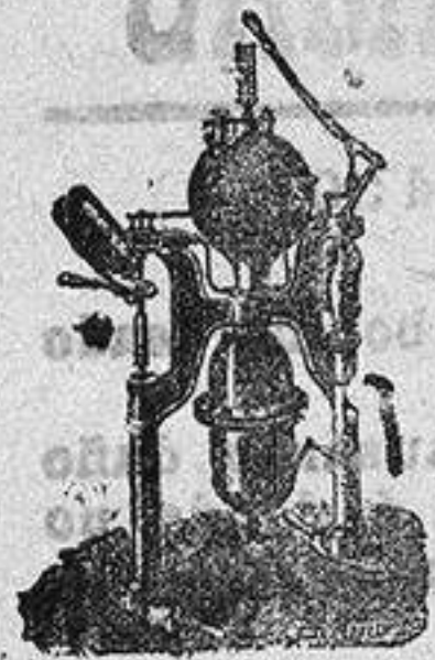
Máquina para hacer gaseosas