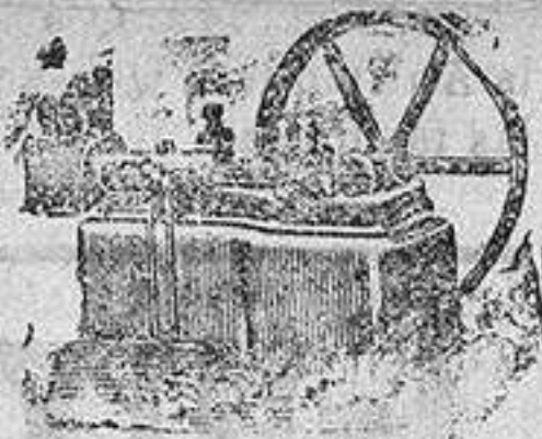
Máquina de vapor locomovil