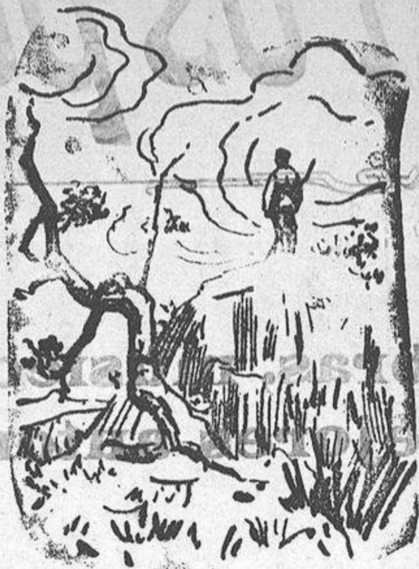
Centinela de avanzada japonesa cerca de Port Arthur

—Hombre, yo preferiría el castigo de los azotes.