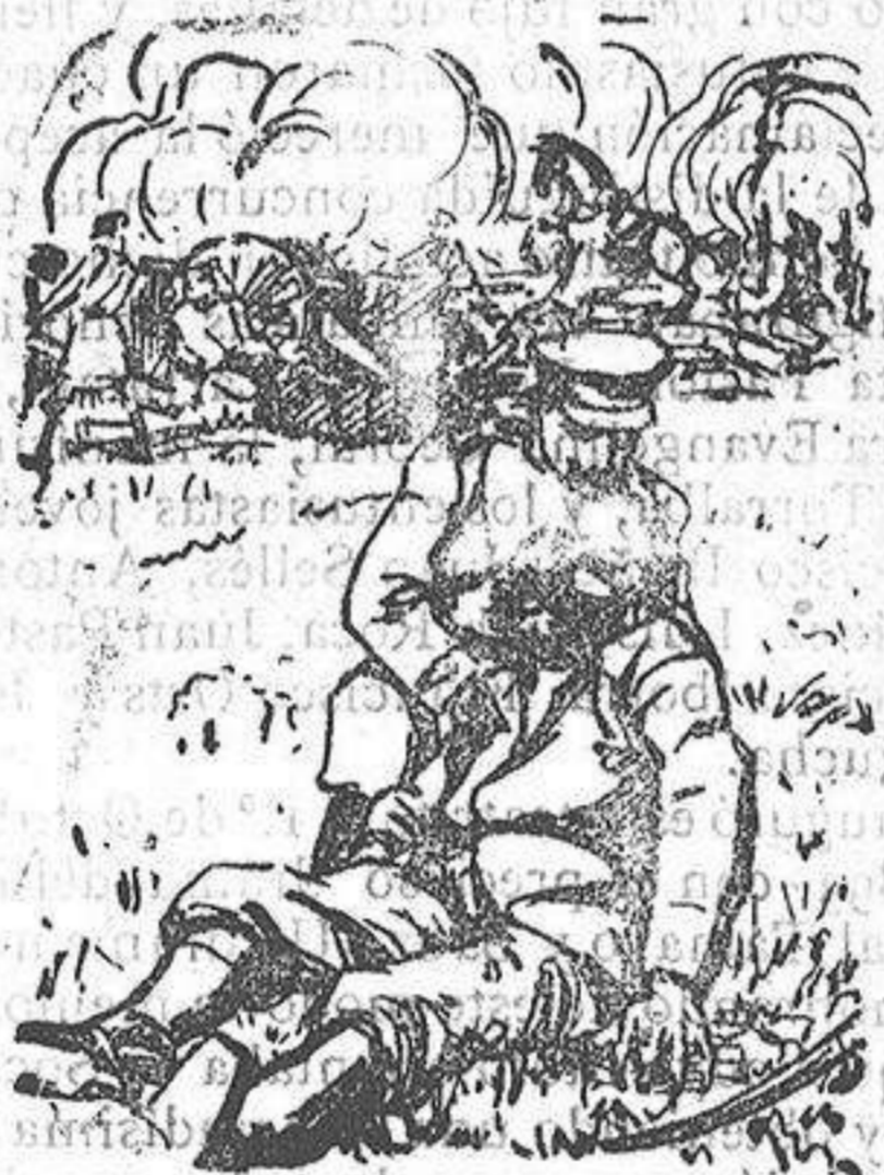
Muerte del general ruso Martroff