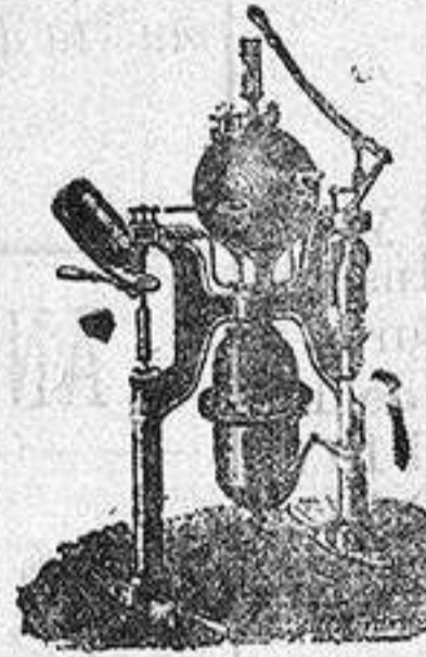
Máquina para hacer gaseosas