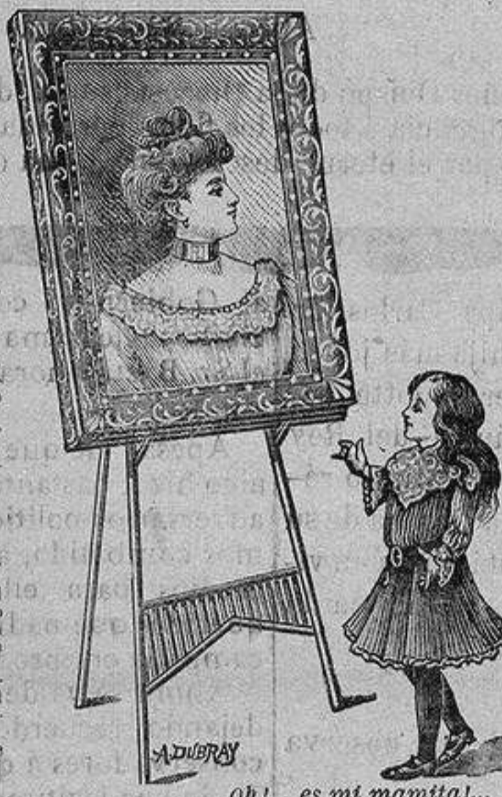
Oh!... es mi mamita...