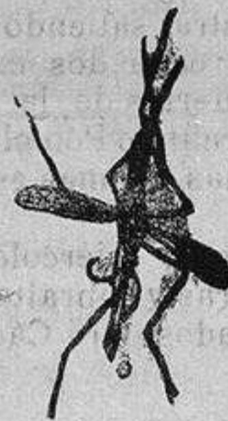
ANOFELE Mosquito que propaga la fiebre palúdica

Dosis curativa: 6 píldoras diarias por quince días. Dosis preventiva y reconstituyente: 2 píldoras diarias.